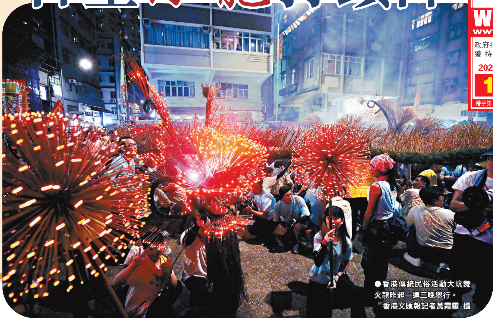
●香港傳統民俗活動大坑舞火龍昨起一連三晚舉行。