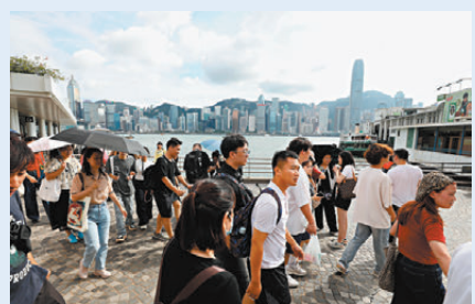
●今年首8個月訪港旅客超過2,950萬人次，按年增加四成半。

各委員就推廣「無處不旅遊」提出了不同建議，例如加大力度發展海島旅遊、綠色旅遊，以及繼續善用科技提升旅客體驗等。