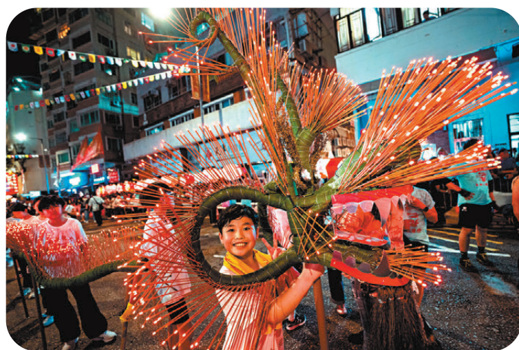
●約100名小朋友舞動長達20米的LED小火龍打頭陣。

大坑舞火龍2011年列入第三批國家級非物質文化遺產，每年吸引大批市民和遊客到場，昨日迎月夜大坑一早封路，傍晚約6時現場人流愈來愈多，舞火龍活動開始前，區內街道兩旁已站滿圍觀的人群。