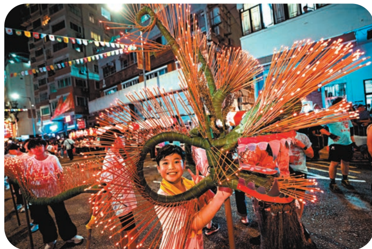
●約100名小朋友舞動長達20米的LED小火龍打頭陣。

大坑舞火龍2011年列入第三批國家級非物質文化遺產，每年吸引大批市民和遊客到場，昨日迎月夜大坑一早封路，傍晚約6時現場人流愈來愈多，舞火龍活動開始前，區內街道兩旁已站滿圍觀的人群。