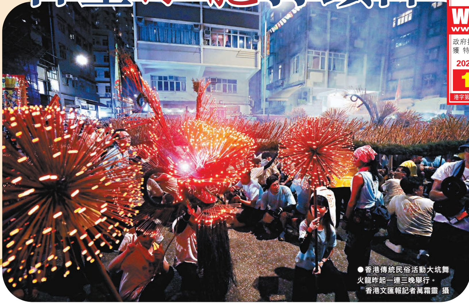
●香港傳統民俗活動大坑舞火龍昨起一連三晚舉行。