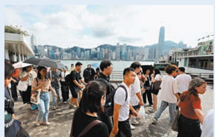
●今年首8個月訪港旅客超過2,950萬人次，按年增加四成半。

各委員就推廣「無處不旅遊」提出了不同建議，例如加大力度發展海島旅遊、綠色旅遊，以及繼續善用科技提升旅客體驗等。