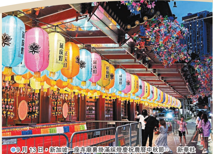
●9月13日，新加坡一座寺廟裏掛滿綠燈慶祝農曆中秋節。新華社

●9月14日，德國柏林中國文化中心，兒童演員們在慶祝即將到來的中秋節活動中表演節目。新華社