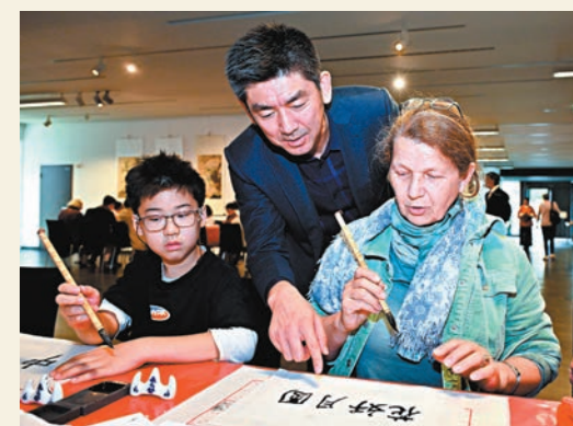
●9月14日，德國柏林中國文化中心，一名女士在慶祝的中秋節活動中學習中國書法。