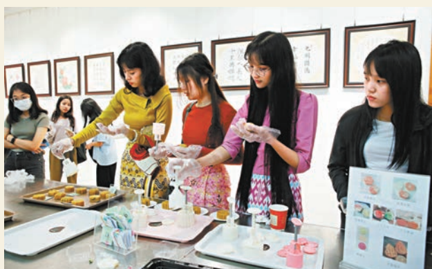
●9月14日，緬甸仰光中國文化中心，學生們在慶祝即將到來的中秋節活動中製作月餅。