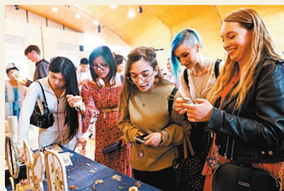
●9月8日，英國倫敦，人們在漢服展示活動中參觀市場攤位，慶祝即將到來的中秋節。