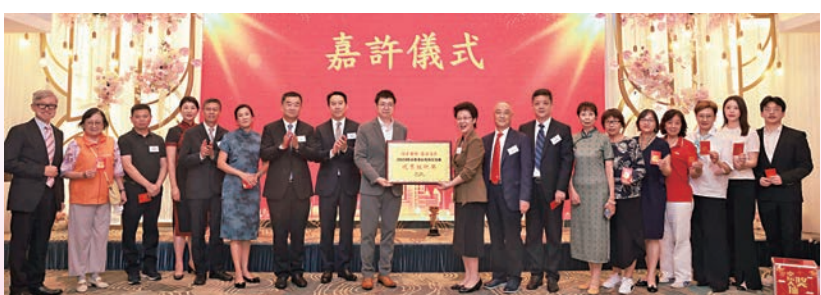
▲在活動中，舉行了香港南通同鄉會義工隊和青年會嘉獎儀式。