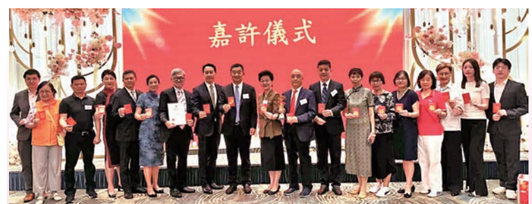
▲大會為獲得香港義工聯盟頒發義工團隊銅獎的香港南通同鄉會義工隊送上中秋祝福以作鼓勵。