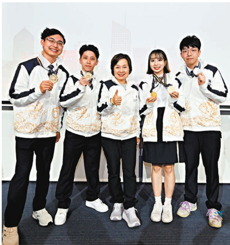
▲蔡若蓮與香港代表隊分享得獎的喜悅。蔡若蓮讚揚一眾選手展現了香港青年人的才華和鬥志。