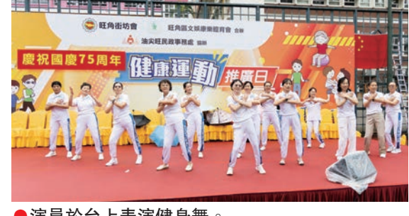
●演員於台上表演健身舞。