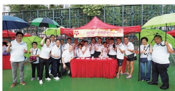
●踢毽球班攤位工作人員合照。