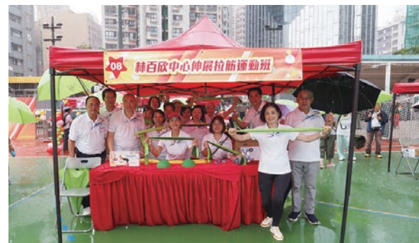
●伸展拉筋運動班攤位工作人員合照。