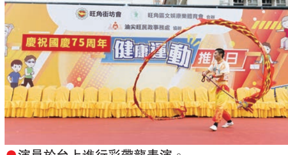
●演員於台上進行彩帶龍表演。