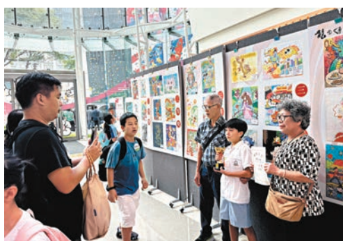
●不少香港學生在比賽中獲獎。