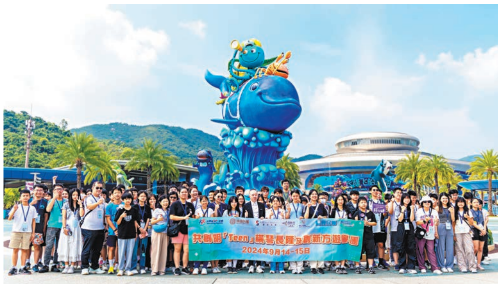
▶香港「共創明『Teen』」研學團北上開啟研學之旅。

琴澳深度合作區琴澳跨境電商產業園（創新方），助力開闊青年學員眼界，加深了解國家新科技發展，推進對青少年學員的愛國主義教育。