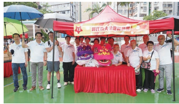
●金龍醒獅團攤位工作人員合照。