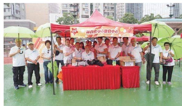
●健身中心攤位工作人員合照。