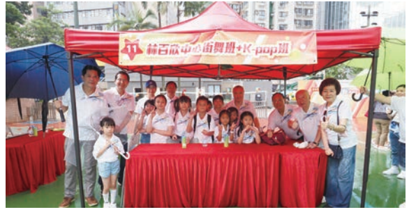
●街舞+K-Pop舞攤位工作人員合照。