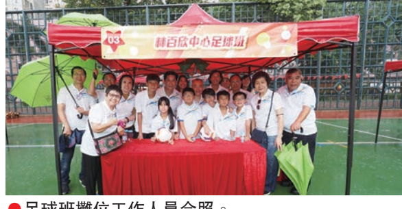
●足球班攤位工作人員合照。