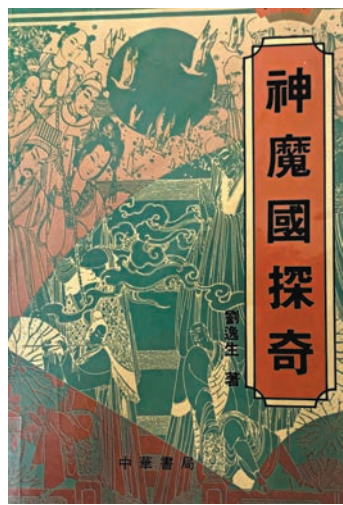
有趣的書，豈可不讀！