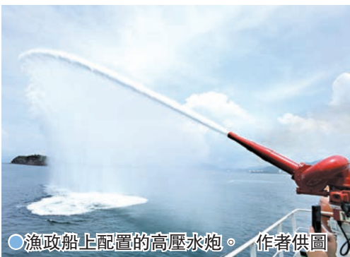
漁政船上配置的高壓水炮。作者供圖