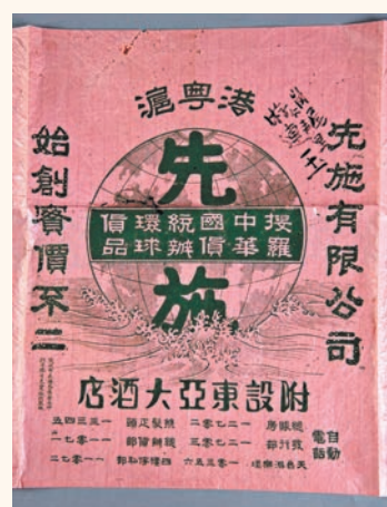
●先施公司印有「滬粵港」及標語的包裝紙。廣東革命歷史博物館藏

長堤位於廣州市區、珠江北岸，興建於清末民初，是近代廣州一條十分重要的商業街，也是近代廣州城市發展的縮影。在它建設發展的歷史過程中，社會功能逐漸增強，粵港兩地的溝通聯繫也越發緊密。展覽共分為「沿江而起」「多元建築」「省港印記」三個部分，「沿江而起」展示廣州長堤填海造地興建的緣由、過程以及長堤