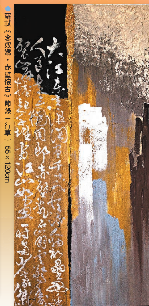
●蘇軾《念奴嬌·赤壁懷古》節錄（行草）55 x 120cm

陳樂怡師從書法家戚谷華，戚谷華師承費新我、錢君匋，上溯馮子愷先生和弘一法師李叔同。從老師那裏得到的傳承與滋養，深深影響了陳樂怡，並為她打下堅實的基本功。「戚老師主張以行書入門的方式，可以令手腕更加靈活，做到『四面靈動，八面出鋒』。其實入門的書體次序並無定法，因為筆法之間是相通的，學行書後再入楷書，我亦可以用行書筆法來理解楷書的筆法。」陳樂怡說。