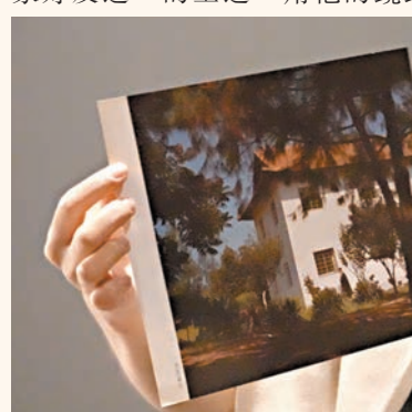
●張大千所建的大畫樓。

1961年，《巨荷》在巴黎首展，展覽圖錄由常玉設計，收錄王之一所攝紀錄，展出之後好評如潮，又受邀參展巴西第六屆聖羅羅雙年展，其後在紐約赫希爾爾德勒畫廊為張大千舉辦個展時，這一作品獲美國讀者文摘社以破紀錄十四萬美元購藏。張大千曾向好友黃天才表示，他畫巨荷圖目的並不在賣錢，而是想在海外多向外國人介紹中國傳統水墨畫：「之所以畫這麼大一幅畫，是要引起西方人注意及重視。《巨荷》在歐洲、南北美洲的展覽都很轟動，令人高興，中國傳統水墨在西方藝壇算是揚眉吐氣了。」畫家原本希望可以將這幅作品帶到亞洲展出但未果，如今夙願得償，觀眾亦可一睹張大千的筆墨，及其背後畫家的雄心與寄託。