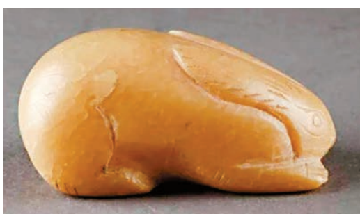
▲陝西歷史博物館藏滑石兔。

在北京，中國國家博物館推出了「鳳凰故國——青銅時代曾楚藝術展」，為觀眾帶來世上最早的「冰箱」——曾侯乙銅鑿缶，鑄造工藝至今難以還原的建鼓銅座、人氣「萌物」青銅鹿角立鶴、聞名天下的越王州勾劍、薄如蟬翼的龍鳳紋羅單衣袖等200餘件珍貴曾楚文物，其中一級品多達45件。另外，在國博的常設展「中國古代飲食文化展」中，觀眾還能看到精美的古代月餅模具等文物。有觀眾表示，「『海上生明月，天涯共此時』的結語，搭配一桌美食模型，別有韻味。」