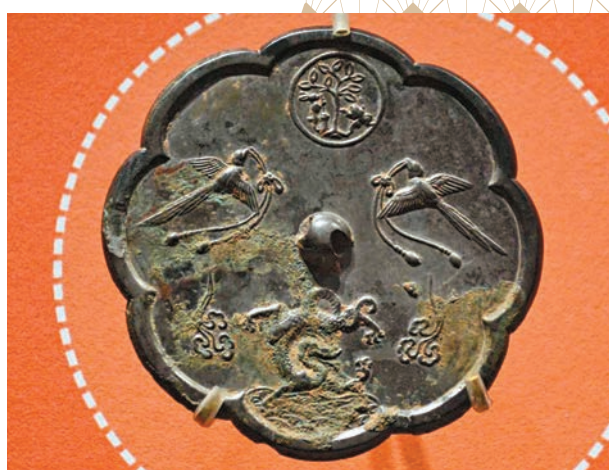
▲「唐代雙鸞月宮菱花鏡」的正上方一輪明月高懸，月宮的輪廓在月光的照耀下若隱若現。