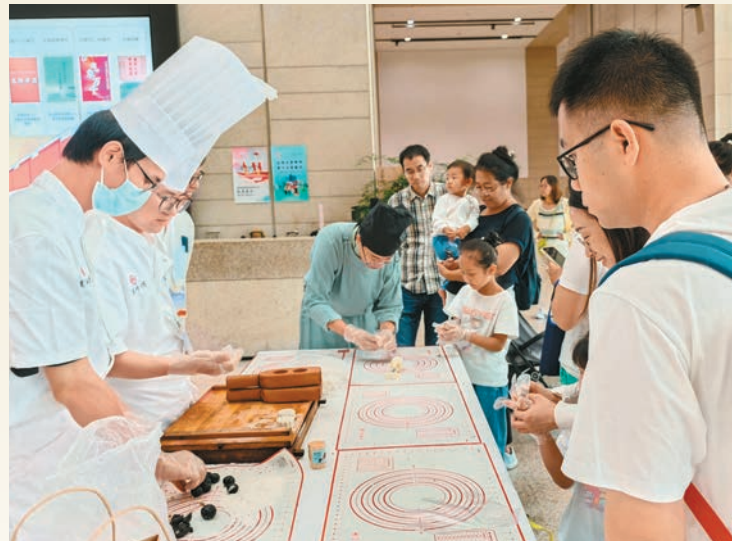
●遊客在中國工藝美術館、中國非物質文化遺產館體驗月餅製作。