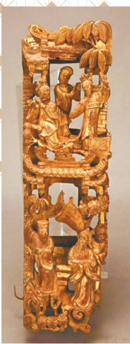
►廣東省博物館藏品清代木雕「唐明皇遊月宮橫欄角花」。香港文匯報廣州傳真