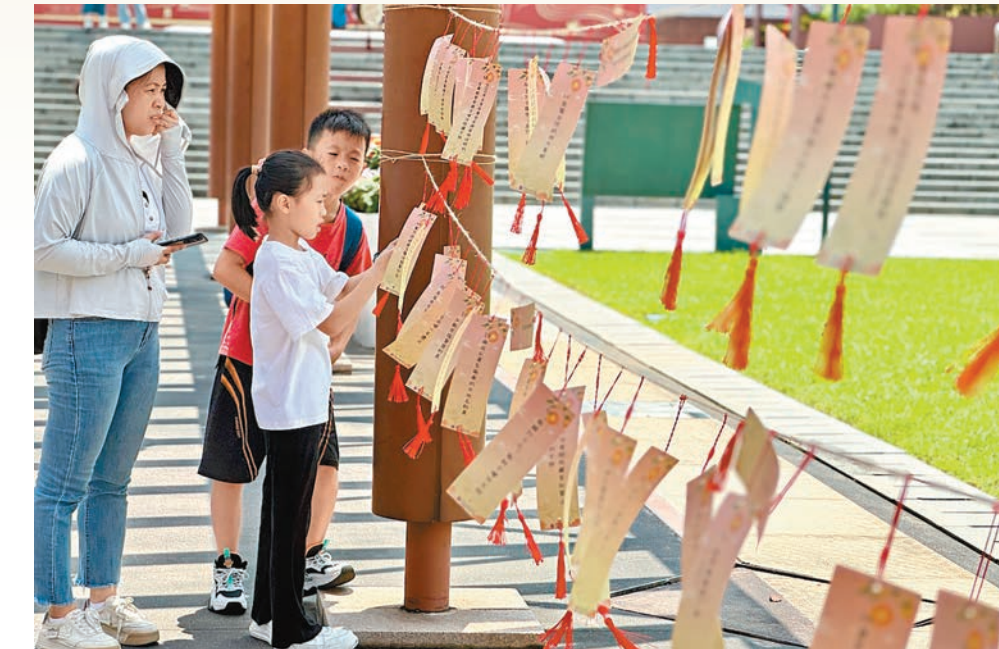
●南越王博物院在廊道兩旁布置了中秋燈謎，吸引路過遊客猜燈謎。