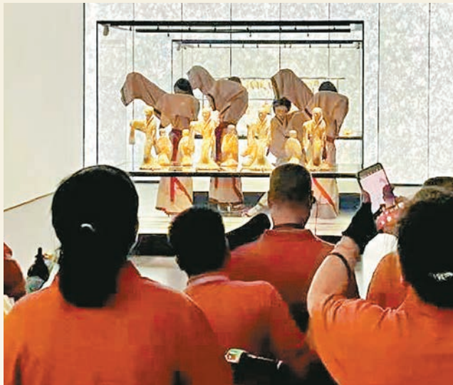
●陝西歷史博物館吸引眾多遊客。