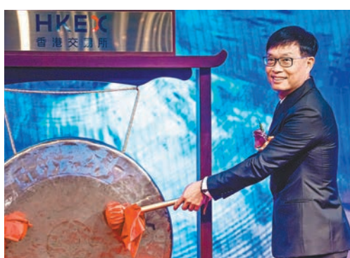
美的集團董事長方洪波表示，在港上市將有助進一步加快集團全球化進程。

香港文匯報訊(記者 周紹基)美的集團(0300)昨日在港交所掛牌，股價曾一度高見60元，較54.8元的招股價高近一成，全日收報59.1元，仍較招股價有7.8%的進賬，全日成交額38.4億元。以昨日其H股收市價計，市值約290.8億元。以每手100股計算，散戶每手賺430元。今次美的集團集資淨額約307億元，是近3年來本港最大的新股。在公開發售部分，美的集團獲超額認購4.31倍；國際發售部分則超購7.1倍。