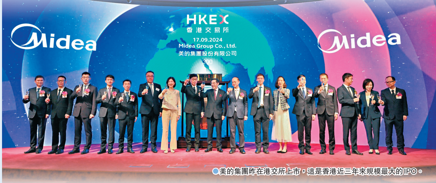
美的集團昨在港交所上市，這是香港近三年來規模最大的IPO。