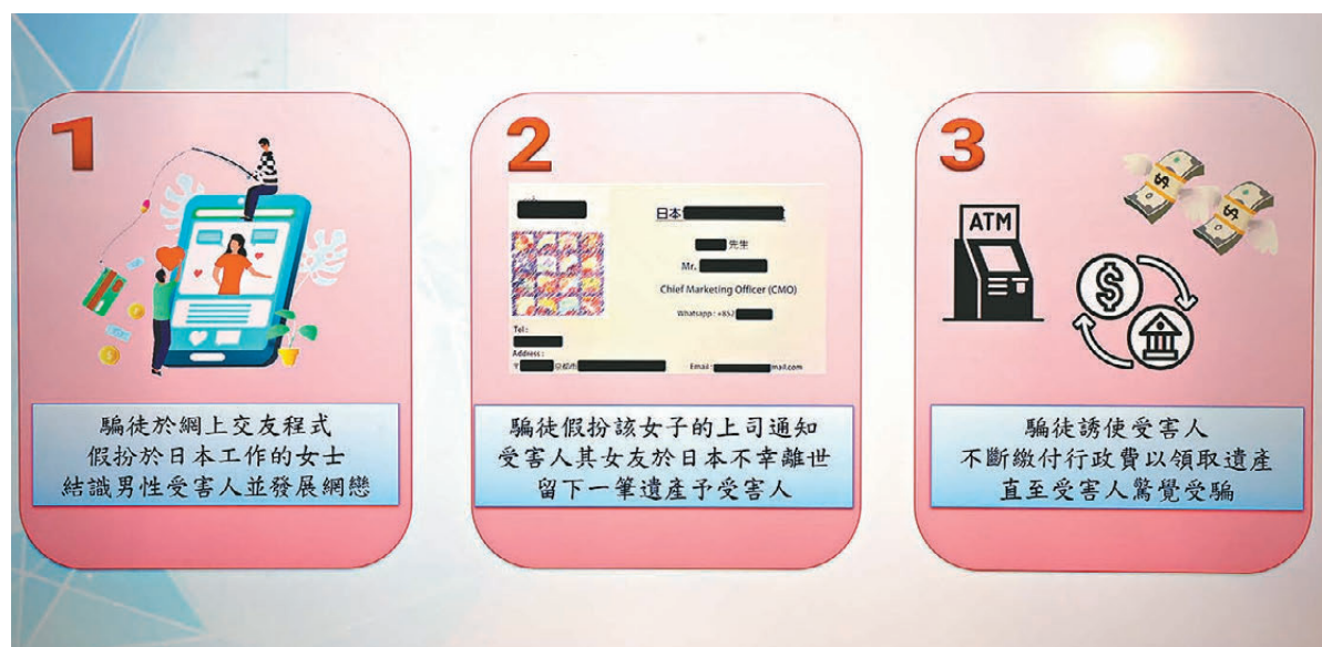
●「網上情緣」騙徒詐騙受害人三部曲。