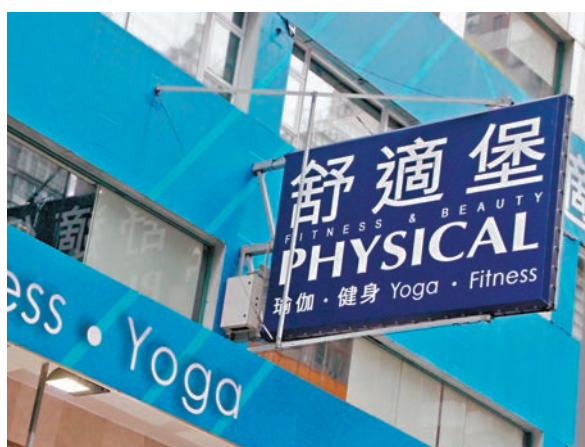
●大型連鎖健身美容中心舒適堡本月6日突然宣布「暫時全線結業」。資料圖片

積金局強調，高度重視僱主拖欠強積金供款的情況，積金局成員保障及服務部專責處理有關涉嫌違