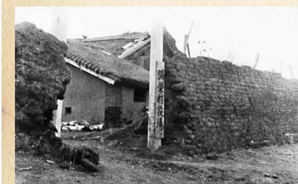
● 1933年2月，日本第一批退伍軍人為主的武裝試驗移民進駐佳木斯永豐鎮，設立了東北地區第一個移民村——彌榮村。