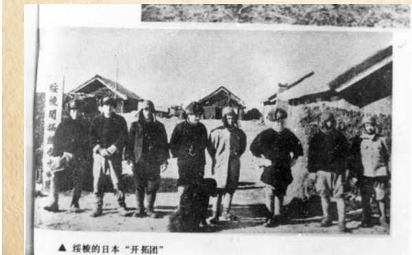
● 在黑龍江省綏化縣的日本移民。