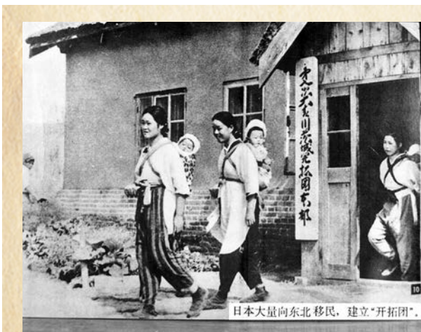
● 日本向中國東北大量移民，建立「開拓團」。