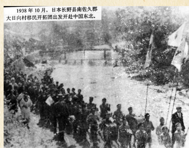
● 日本長野縣移民「開拓團」出發開赴中國東北。