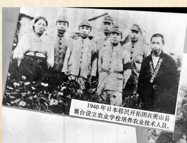
● 日本移民「開拓團」在中國設立農業學校培養農業人員。