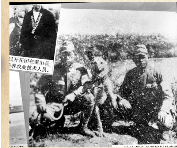
● 黑龍江省佳木斯市樺川縣日本武裝「開拓團員」。