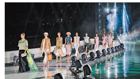
●在瀋陽市被譽為亞洲最大露天泳池的168米超長無邊泳池旁，一場將旗袍融入空間的走秀於文化周期間精彩上演。

水，將空間設計與旗袍融合，「我更期待將傳統文化通過這樣的美學空間、文化空間展示出去。」