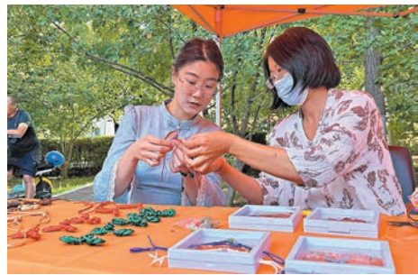
●旗袍文化周期間，一位青年女性身著旗袍在瀋陽市和平區旗袍文化創意市集上學習傳統手工盤扣技藝。