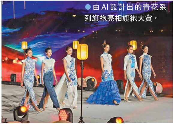
●由AI設計出的青花系列旗袍亮相旗袍大賞。