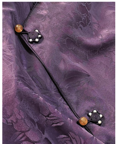
▲「萌系」旗袍的貓爪盤扣設計受到年輕消費者的青睞。