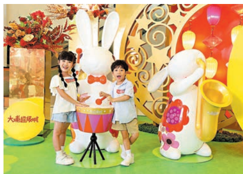
●舞台上有萌兔音樂家陶醉地彈奏，奏響熱鬧樂章。