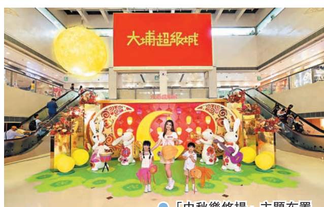
●「中秋樂悠揚」主題布置

同時，由即日起至10月1日，商場大派HK$1電影票，請大家看夜場電影，大家在場內消費滿HK$100，即可以HK$1票價換領嘉禾大埔指定優惠期內晚上6時後場次換票證一張，推動大家夜玩商場，齊齊看夜場電影。為慶祝國慶75周年，如The Point會員身份證號碼含