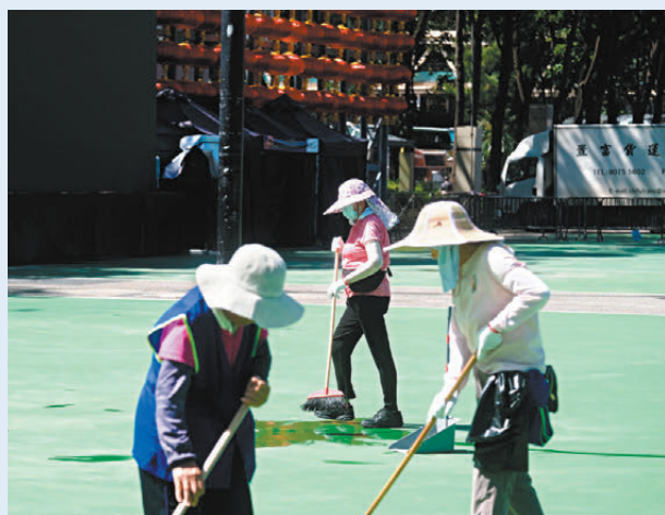
●中秋節過後，昨晨有清潔工人於維園足球場內清理垃圾。

香港文匯報訊（記者 張弦）中秋佳節，香港有不少市民一家大小帶備燈籠、荧光棒、月餅等小食外出看綵燈或賞月慶祝，然而歡樂過後或留下一地狼藉。在觀塘海濱中秋夜一場黃雨令眾人落荒而逃，現場遺留大批垃圾，直至昨晨由清潔工人清走。在維園，香港文匯報記者昨日到場了解，只見環境整體乾淨，只遺下少許紙巾、膠袋、汽水罐等。有清潔工人表示，今年中秋節後垃圾量較以往減少，相信與公眾法律與環保意識提升有關，現場亦放置了更多垃圾桶，方便市民自己垃圾自己清。