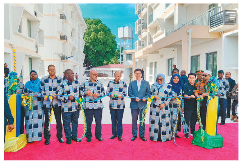
●2024年7月1日，中國援坦桑尼亞桑給巴爾阿卜杜拉·姆才醫院醫務宿舍項目啓用揭牌。

「中國不僅給我們援建了醫院，捐贈了設備，擁有精湛醫術和高貴品德的中國醫生同行，還無私地分享了從醫經驗和診斷技巧。如今我們又即將住進夢寐以求的宿舍，感謝中國。」對於很多阿卜杜拉·姆才醫院的醫護來說，與中國的情緣是一種幸福，更是一生的財富。他們也希望將中國的大愛，不僅銘記於心，更能傾注到日常工作中，讓更多桑給巴爾民眾感受到來自中國的溫暖和幫助。