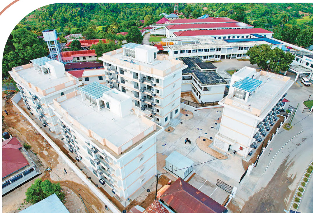
●中國援建的坦桑尼亞桑給巴爾阿卜杜拉·姆才醫院醫務宿舍項目。

「我們要給當地留下一支『帶不走的醫療隊』，所以授人以漁，好過授人以魚……」去年年底，以中國援坦桑尼亞桑給巴爾醫療隊為原型創作的電視劇《歡迎來到麥樂村》，一開播便熱爆內地。劇中由著名演員祖峰飾演的中國醫療隊隊長江大喬，國慶節與隊員們聚會時說出的這句話，不僅道出了一名醫者的仁心大愛，同時更再次彰顯了中國援外醫療事業始終不變的初心和使命。