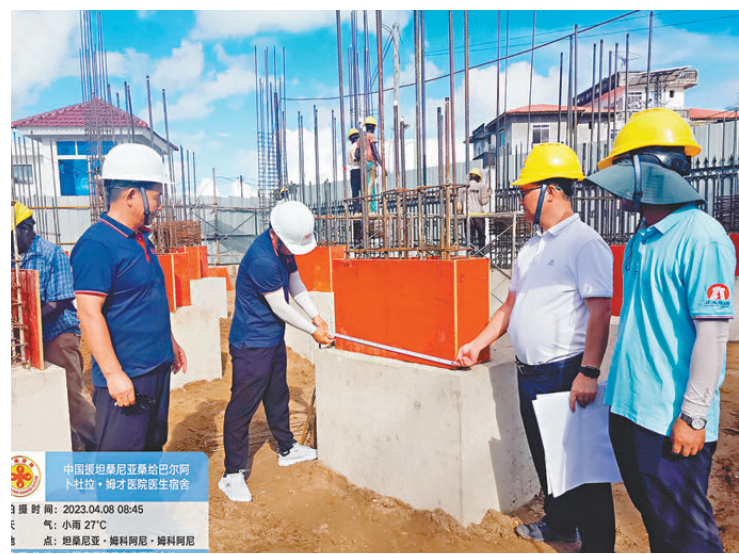
●中國援坦桑尼亞桑給巴爾阿卜杜拉·姆才醫院醫務宿舍項目施工現場。