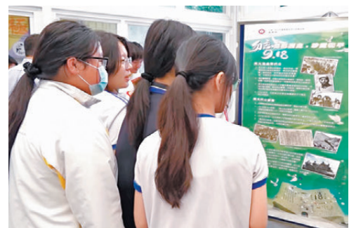
●香港學校在中史課教授九一八事變史實，期望學生借古鑑今，明白戰爭禍害。