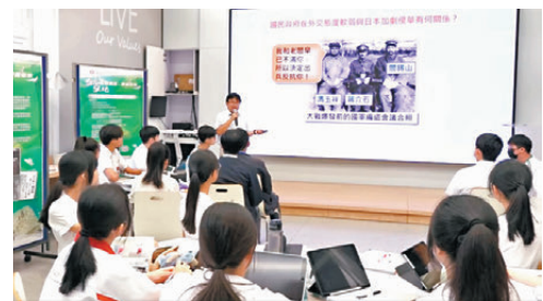
●港校因應不同年級的教學進度，讓同學以更多元化素材，豐富對抗戰歷史的認識。