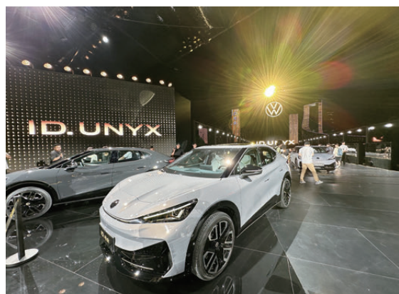
●大眾首款智能電動轎跑今年7月在合肥宣布上市。

安徽是中國重要的製造業基地，亦是唯一被「一帶一路」倡議和長江經濟帶發展、中部地區高質量發展、長三角一體化發展等多個國家戰略疊加覆蓋的省份。近年來安徽搶抓發展機遇，