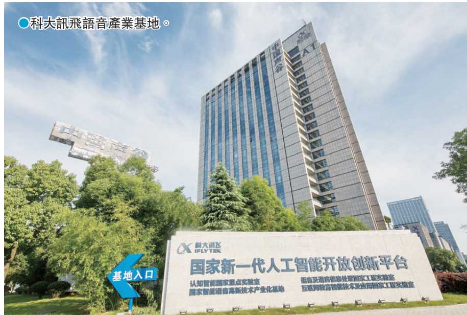
●科大訊飛語音產業基地。

突出辦會實效，本屆大會堅持「走出去」與「引進來」相結合，聚焦安徽省「4433」萬千億產業體系，統籌謀劃傳統產業優化升級、新興產業培育壯大和未來產業前瞻布局，持續深化項目對接。大會邀請央企、外企、港澳企、台企、僑企、民企代表相聚安徽，將舉辦安徽省與中央企業合作發展座談會、安徽省新興產業與跨國公司對接會、皖港澳製造業合作交流對接會、皖台優勢產業合作推進會、僑創項目對接暨巢湖僑創會、中國製造業民營企業合作交流對接等系列活動，目前已初步摸排大會備選簽約項目超700個、投資額超3,500億元。