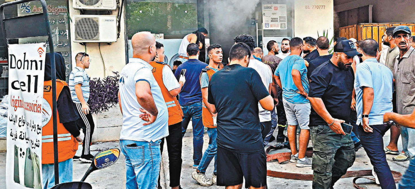
黎巴嫩對講機系統周三爆炸，一間店舖起火。