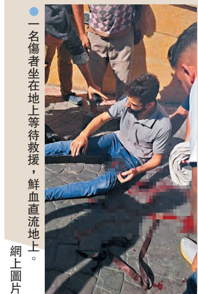
一名傷者坐在地上等待救援，鮮血直流地上。 網上圖片

香港文匯報訊 黎巴嫩真主黨成員的傳呼機系統周二(9月17日)集體爆炸，截至周三造成至少12人死亡，近3,000人受傷，死者包括兩名兒童，其中一名女童年僅8歲。路透社報道，估計以色列情報機關摩薩德在數月前，暗中攔截真主黨進口的5,000部傳呼機，並在傳呼機安裝炸藥，爆炸事件源自以情報部門與軍聯合行動。黎巴嫩當局譴責以色列策劃「侵略行為」，真主黨指以須承擔全部責任，揚言會採取行動報復。