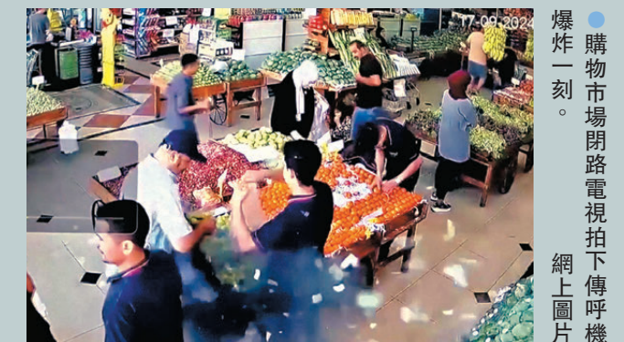
購物市場開路電視拍上傳呼機爆炸一刻。 網上圖片