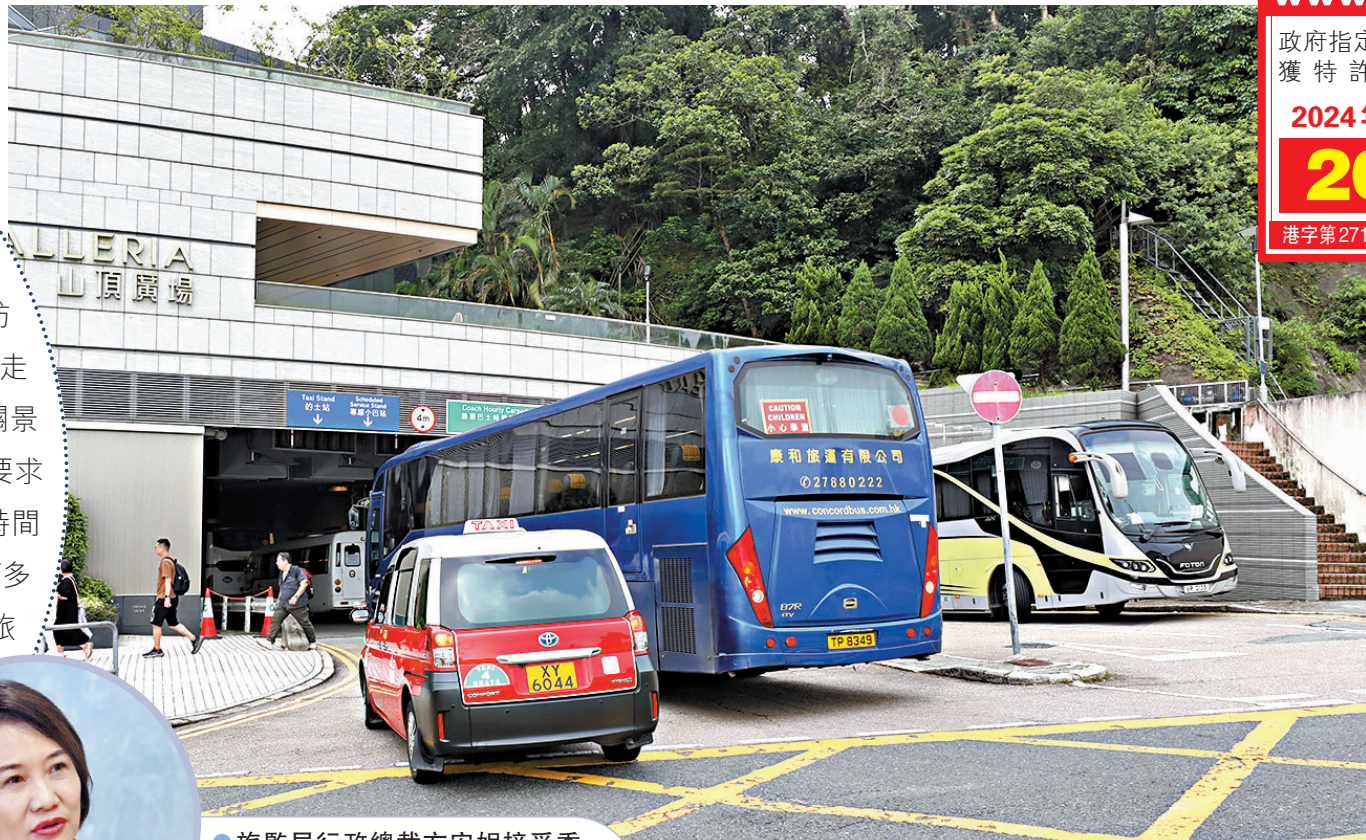
▲旅遊巴士排隊等候駛入山頂廣場停車場，嚴重阻塞通道。 香港文匯報記者黃艾力 攝

旅遊巴塞山頂、淺水灣等旅遊景點的問題，香港文匯報記者訪問了各界人士為問題找出可行方案。方安妮日前在接受香港文匯報訪問時指出，目前每日有約百多個旅行團訪港，雖然相比以往旅遊高峰期每天有700多旅行團抵港的盛況，團數已大幅減少，但由於旅遊巴士體積大，對景點附近的交通構成沉重負荷。