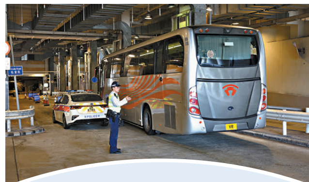
●警方昨日到山頂廣場對違例停泊旅遊巴士執法。

山頂分區警署表示會定時與不同持份者溝通，包括旅遊業監管局、山頂纜車公司、商場物業管理負責人等，積極研究可行的方法，提升接待旅客能力，致力維護香港良好的旅遊形象。國慶節假期即將來臨，警方會密切監察山頂廣場一帶的交通情況，視乎情況善用資源，維持現場交通暢順，保障所有道路使用者的安全。