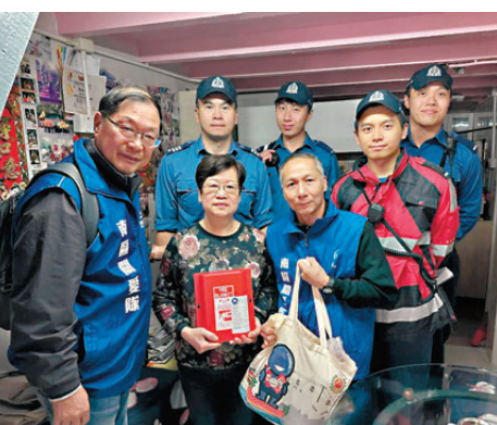
●置富關愛隊聯同消防處向居民派發「防火三寶」。

他還建議改善運動員薪酬待遇、擴大資助申請途徑，為運動員提供特別證書使其能夠在學校任教，搭建社會關注支持平台等，讓運動員發揮更多商業價值與社會價值。