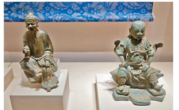
●持藥杵道教神像（左）和銅真武像。

展覽中的《李白行吟圖軸》、《蜀道難軸》、六經堂《分類補註李太白詩》刻本、《杜子美詩集》刻本等文物，都讓觀眾直觀地看到了與蜀道相關的文化留存。