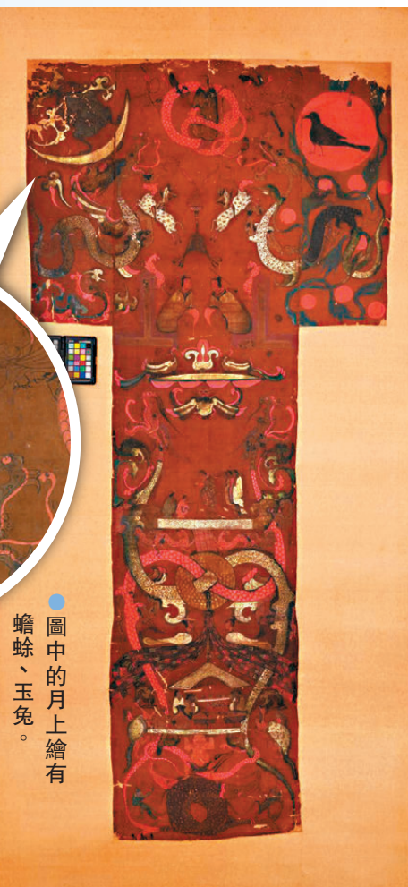
●圖中的月上繪有蟾蜍、玉兔。