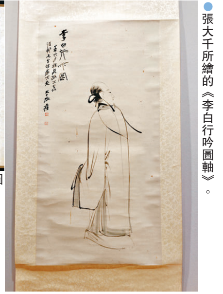
●張大千所繪的《李白行吟圖軸》。