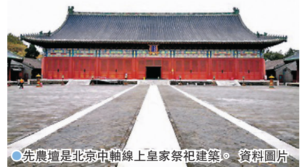
●先農壇是北京中軸線上皇家祭祀建築。資料圖片

北京古代建築博物館日前通報，經過拆除非文物建築、修繕文物建築後，布局恢宏、裝飾精美的先農壇慶成宮古建群重煥新生，歷史風貌得到極大恢復，未來將面向公眾開放。