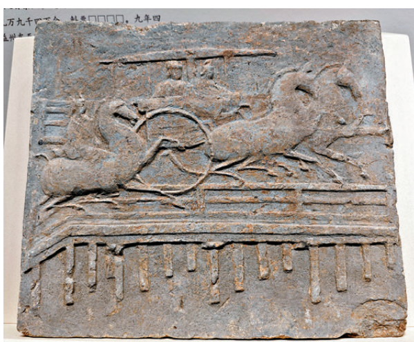
●在車馬過橋畫像磚中有關於樑柱橋的內容。

「自古詩人皆入蜀」。從「蜀道難，難於上青天」的不可凌越，到「雲飛不到頂，鳥去難過壁」的巍峨險峻，從「長廊郁翠柏，斜陽照五津」的如畫風光，到「樓船夜雪瓜洲渡，鐵馬秋風大散關」的刀光劍影，從「雲連蜀道三千里，柳拂江堤十萬家」的如織來往，到「山川連蜀道，市井雜夷歌」的交流融通……蜀道自開通以來，歷代文人留下了眾多與之有關的文学作品，從表現蜀道的險峻到對歷史人生的感懷，蜀道文學構成了自己獨特的文化語境。