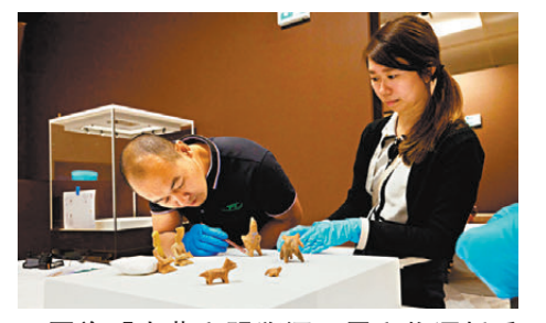
●圖為「中華文明溯源」展文物運抵香港故宮文化博物館。 資料圖片

香港文匯報訊（記者 吳健怡）為慶祝新中國成立75周年，西九文化區管理局將於本月27日至下月1日期間，於西九文化區內為訪客提供消費獎賞及多項餐飲和消費優惠，包括購買指定產品與餐飲產品時將提供七五折優惠等。在國慶黃金周期間，香港故宮文化博物館將延長開放時間，讓訪客歡度國慶，惟只會預留少量門票供現場發售，呼籲訪客提前預訂門票。 由本月27日至下月1日期間，西九文化區內指定餐廳、輕食店、美食車及商店購買指定產品和餐飲產品時將提供七五折優惠，涵蓋特色餐飲與文創產品。訪客於該段期間於區內指定餐飲及零售店舖，同日以電子支付方式消費滿500元，可換領50元現金券，消費滿800元更可換領100元現金券。 西九管理局表示，M+的特別展覽「郭培：藝想天開」及香港故宮文化博物館的特別展覽「中華文明溯源」分別於今日及下周三起向公眾開放，門票現已公開發售，公眾可在西九文化區網上購票平台和票務夥伴平台購買或預訂。 在國慶黃金周期間，香港故宮文化博物館將於下月1日維持開放，並於下月2日至7日延長開放時間到上午10時至晚上8時。國慶當日M+的持票訪客將獲贈精美紀念品，先到先得，送完即止。 因應國慶當晚舉行的煙花匯演將吸引大量訪客前往西九文化區，西九管理局將實施人潮管理措施及特別交通措施，並會與政府有關部門進行緊密溝通，具體細節將適時公布。 西九文化區推餐飲優惠 港故宮館黃金周「加時」