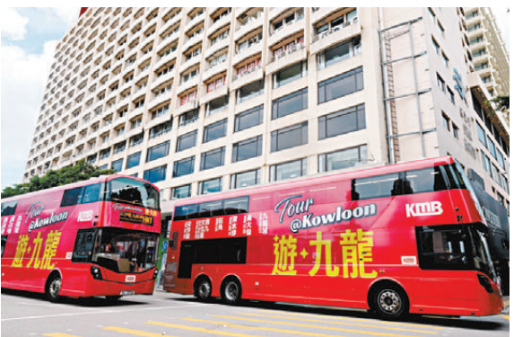
●九巴開辦全新「遊·九龍」旅遊路線HK1，將以循環線形式途經尖沙咀碼頭、西九文化區及黃大仙祠等九龍區景點。

香港文匯報訊（記者 王僊）國慶黃金周假期料會迎來大批訪港旅客，九巴於今日起開通全新「遊·九龍」旅遊路線「HK1」，以循環線形式途經尖沙咀碼頭、西九文化區及黃大仙祠等九龍區景點，全程共17個站，收費19元。「HK1」觀光巴士特別設計，以粉紅色為主，座椅特別寬敞，設有免費無線上網、USB充電裝置及窗簾，不設企位，車上設有普通話廣播及途經景點的文字介紹，九巴指日後會逐步引入其他語言，希望給遊客良好的旅遊體驗。 經西九文化區廟街等 單程19元 日票55元 HK1由尖沙咀碼頭出發，依次途經西九文化區、佐敦、油麻地、旺角、太子、深水埗、黃大仙及九龍城，最後返回尖沙咀碼頭。巴士車身以搶眼粉紅色為主調，配以「遊·九龍Tour @Kowloon」字眼，讓旅客能輕鬆辨別。巴士座椅甚至比機場巴士更寬敞，並會透過普通話、英語及廣東話三種語言的車廂廣播，介紹沿途知名景點。營運時間由每日上午10時至下午6時，周末及公眾假期會延至晚上8時，約每30分鐘一班車。 為方便旅客暢遊路線沿途的景點，九巴特製《遊·九龍Tour @Kowloon景點指南》，讓旅客上車前閱覽，旅遊時更便捷。旅客可循路線前往西九文化區參觀M+文化博物館與香港故宮文化博物館，以及在西九龍海濱長廊眺望維港景色。巴士沿途又會經過被評為二級歷史建築的舊油麻地警署、油麻地果欄水果