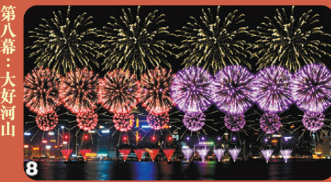
第八幕：大好河山 配樂：《大中國》 這一幕既有絢麗的「中國紅」，亦有象徵特區區花高貴的「大紅大紫色」，不斷綻放。煙花一波一波緊密地逐漸加快，最後33秒以高密度「大哨音」及「華麗錦冠」作結，祝願祖國繁榮昌盛，國泰民安。

第一幕：慶祝中華人民共和國75周年華誕 配樂：《群星黃河協奏曲》 開幕28秒，震撼的開場為中華人民共和國75周年華誕展開序幕。中國五千年歷史文化由黃河河套孕育出無數的生命，這一幕打出「紅色五角星」及「紫色五片花」，象徵着香港向祖國仰望，帶領着民眾邁向更輝煌的百年成就。