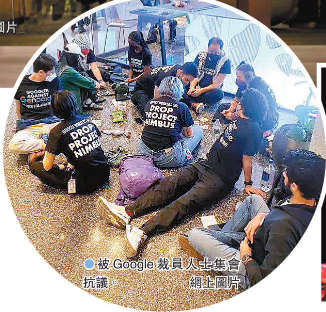
●被Google裁員人士集會抗議。網上圖片