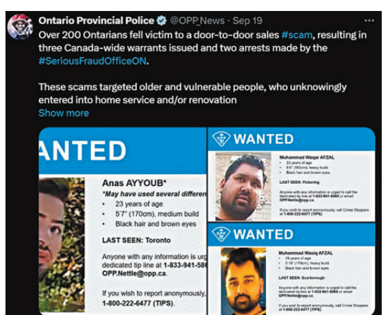
●安省警方發出全國通緝令，追緝3名在逃疑犯。

這種詐欺行為被揭破受到廣泛關注，尤其是受害者可能在不知情下陷入財務危機，最嚴重是被迫出售房屋。故此，警方呼籲公眾有必要留意年長或弱勢的親朋，教導他們對陌生人提高警惕，不應與他人分享財務資訊，更避免簽署合約。為了保障公眾利益，安大略省議會在2024年通過「房屋業主保護法案」，禁止在物業所有權上登記NOSI。法案在6月6日生效，全省在此日期前登記的10億加元(約57.43億港元)的NOSI變成無效。