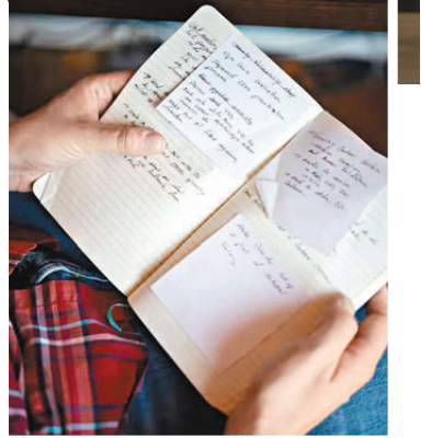
●工程師沃爾茲去年被裁，他寫日記記錄求職情況。網上圖片