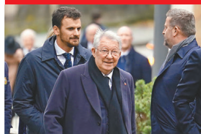
●費格遜退休了11年，至今仍是曼聯主場看台上的常客。

香港文匯報訊 綜合外電報道，帶領曼聯贏得13個英超冠軍頭銜以及勇奪1998/99、2007/08歐聯錦標的傳奇領隊費格遜，在2012/13球季率隊最後一次登上英超冠軍頒獎台後，至今已經退休11年。他退休後並沒有遠離球場，很多時在曼聯主場的看台上仍會見到「費爵爺」的身影。並不常接受專訪的費格遜近日在訪問中，談到了自己對失智症的恐懼，又強調自己有時也會懷念當曼聯領隊的日子。