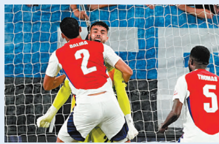
▲拉耶救出12碼助阿仙奴力保1分而回。