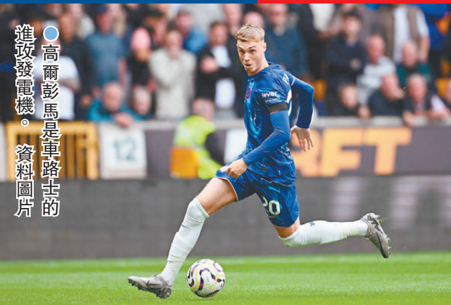
●高爾彭馬是車路士的進攻發機。 資料圖片