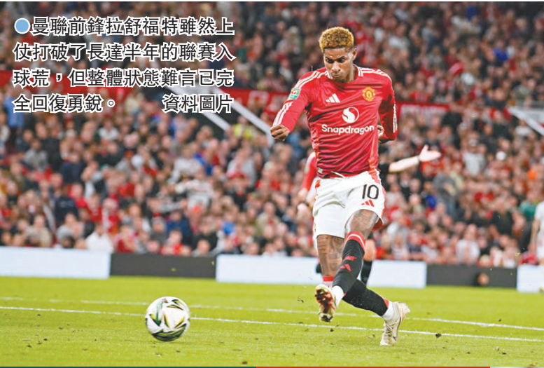
●曼聯前鋒拉舒福特雖然上仗打破了長達半年的聯賽入球荒，但整體狀態難言已完全回復頂銳。 資料圖片