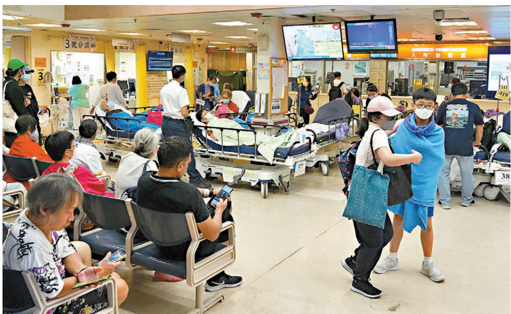
●該名麻疹患者因持續發燒、咳嗽和喉嚨痛到伊利沙伯醫院急症室求醫，同日入院接受治療，本月13日轉往該院隔離病房。圖為伊利沙伯醫院急症室。

衛生防護中心強調，接種麻疹疫苗是最有效預防方法，據小學學童免疫接種覆蓋率，以及衛生署的全港免疫接種覆蓋調查顯示，兩劑麻疹疫苗接種的整體覆蓋率一直達95%以上。本地麻疹病毒抗體的血清陽性率，亦反映絕大部分香港市民對麻疹已有免疫力，顯示本地大型爆發麻疹風險偏低，惟少數未完成接種麻疹疫苗人士仍有機會受感染，並將麻