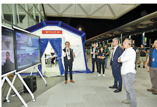
●香港警務處處長蕭澤頤及副處長（行動）周一鳴到場進行監察演練。

面對恐襲圖謀，香港機場警區和新界南總區衝鋒隊迅速反應，及時制止並拘捕該3名恐怖分子。在網絡安全方面，網罪科人員為應對香港國際機場的電腦系統遭受非法入侵，進行了