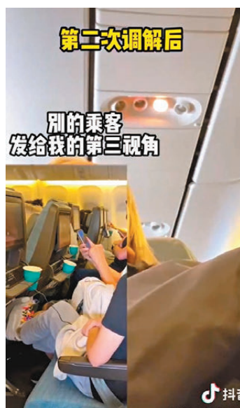
●後排婦人不斷用腳踢向女事主。視頻截圖