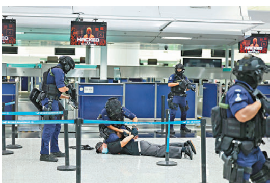
●實地演練中，機場特警組人員制服持槍恐怖分子。

港國際機場及澳門電力股份有限公司發動網絡攻擊，以圖癱瘓主要的公眾服務及製造公眾恐慌。演練中，恐怖分子不僅放置可疑物品及操作無人機以製造混亂，還企圖持槍襲擊市民。