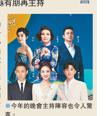
●今年的晚會主持陣容也令人驚喜。