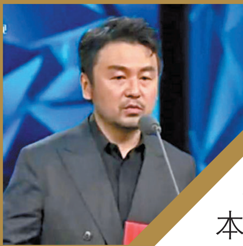
●雷佳音領獎。網絡截圖