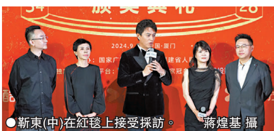
●靳東(中)在紅毯上接受採訪。