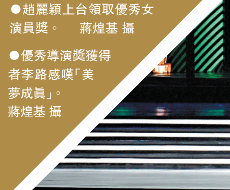
●趙麗穎上台領取優秀女演員獎。