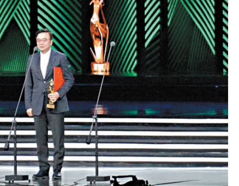
●趙麗穎領獎。網絡截圖