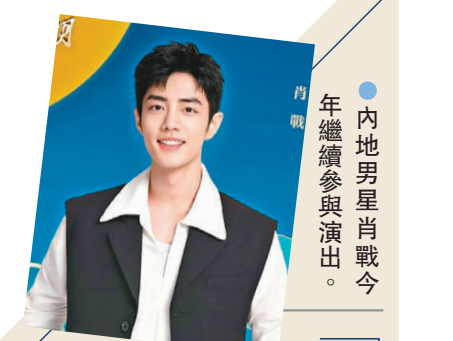
●內地男星肖戰今年繼續參與演出。