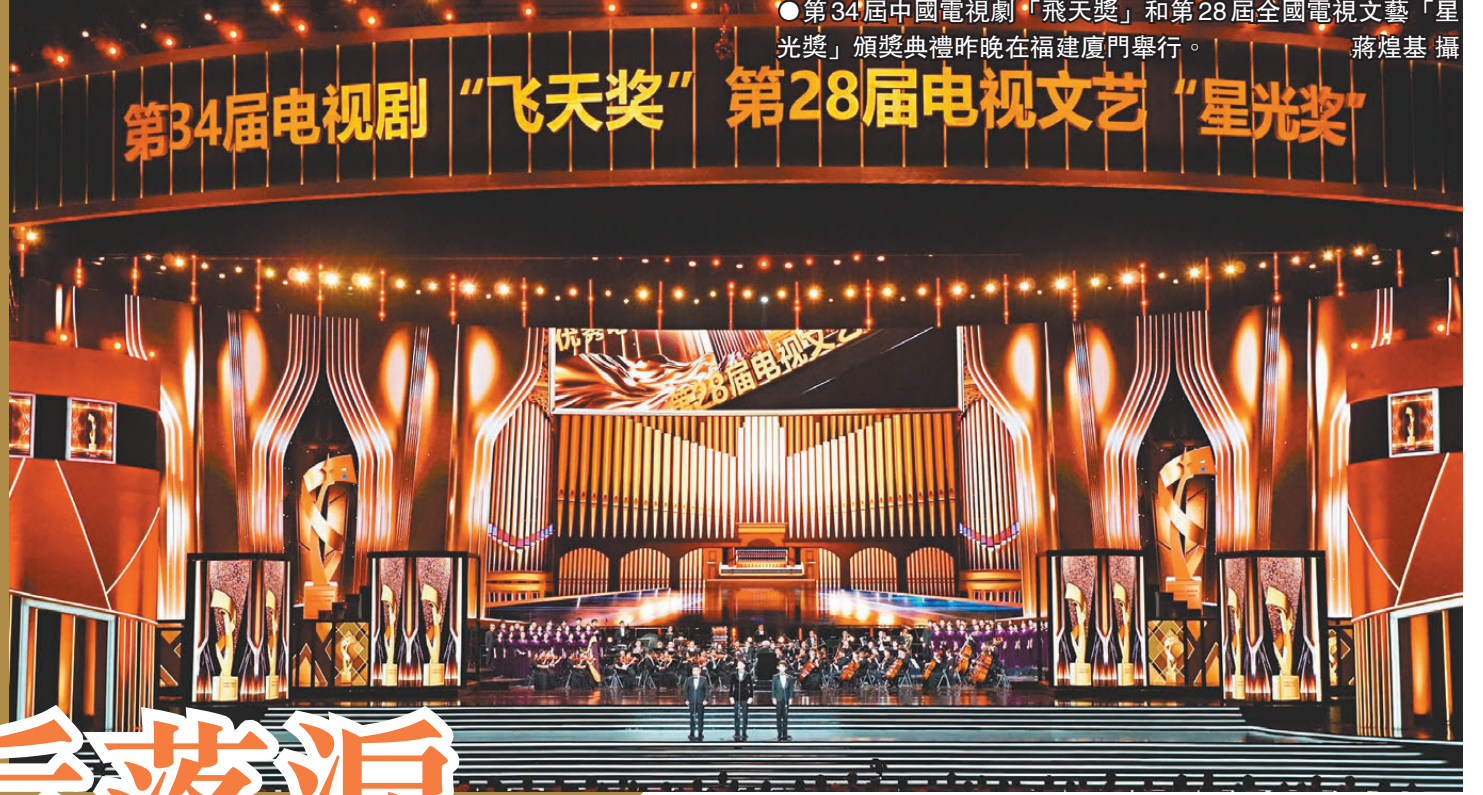
●第34屆中國電視劇「飛天獎」和28屆全國電視文藝「星光獎」頒獎典禮昨晚在福建廈門舉行。