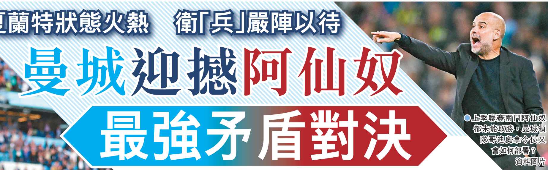
● 上季聯賽兩門阿仙奴都未能取勝，曼城領隊哥迪奧拿今仗又會如何部署？資料圖片