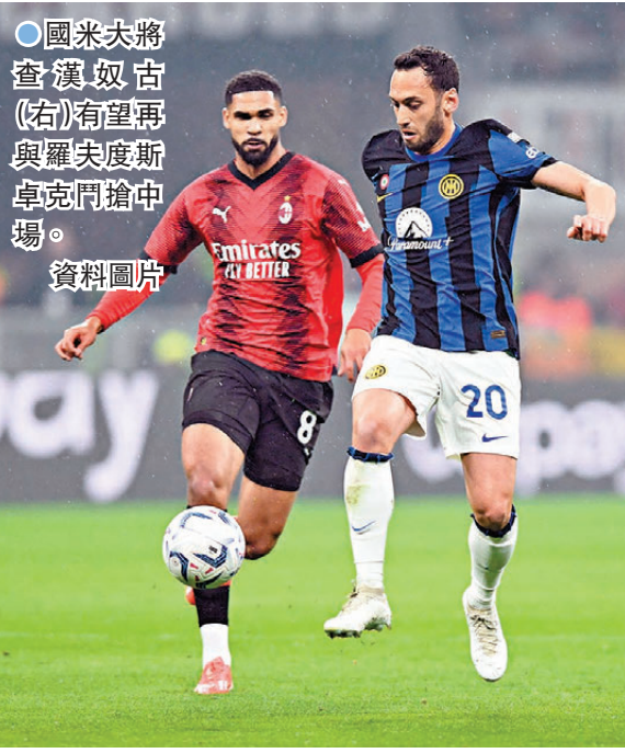
● 國米大將查漢奴古(右)有望再與羅夫度斯卓克鬥爭中場。資料圖片