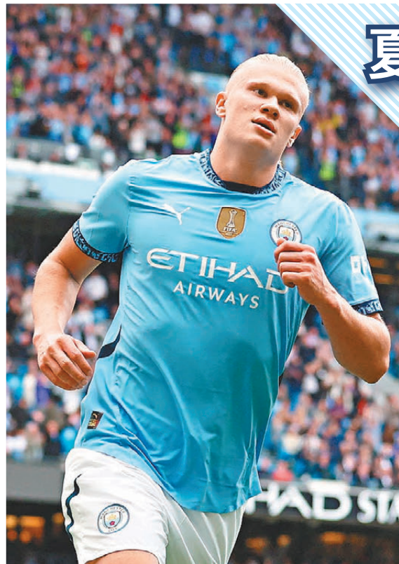
▲ 曼城王牌前鋒夏蘭特開季頭四輪比賽已瘋狂斬獲9個入球。資料圖片