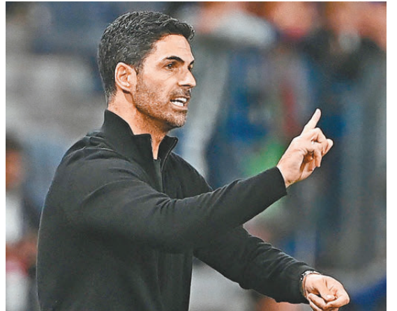
▲ 阿迪達強調已為今場大戰作好準備。