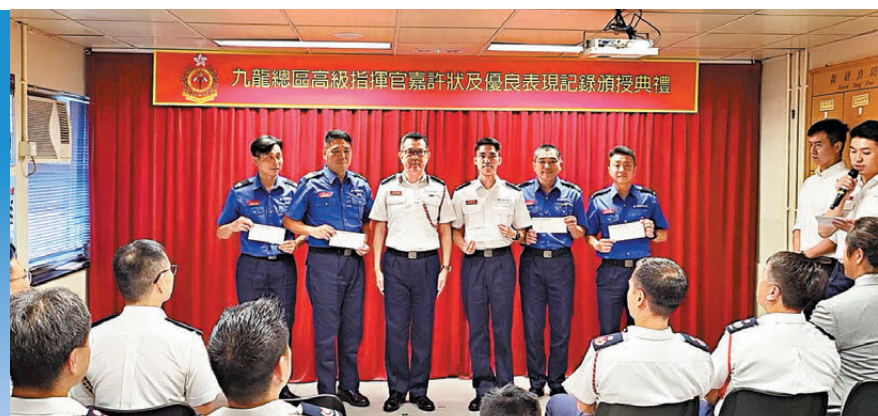
●5名消防人員獲頒授優良表現記錄。