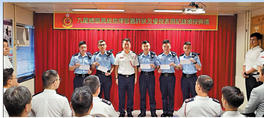
●消防處向5名警務人員頒發感謝信。