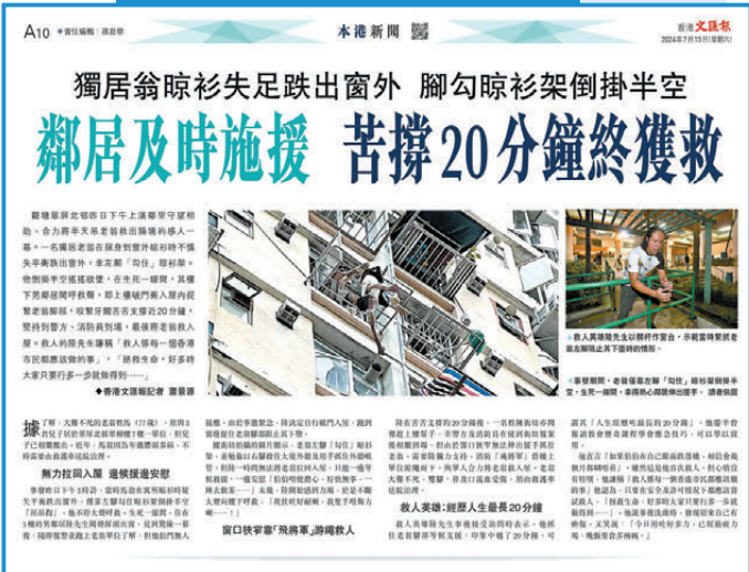
●香港文匯報7月13日 A10 PDF 版面