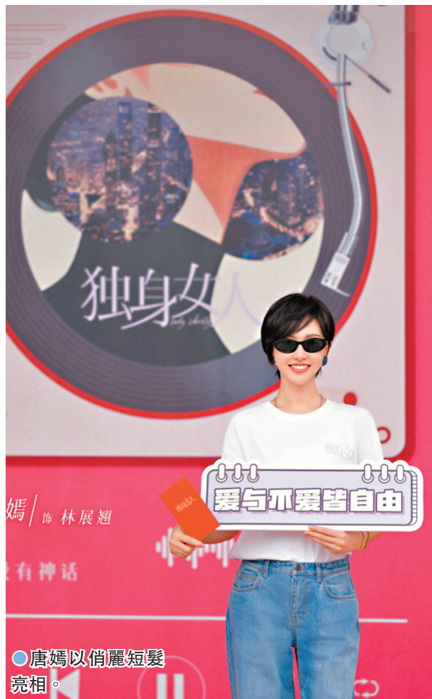
●唐嫣以俏麗短髮亮相。