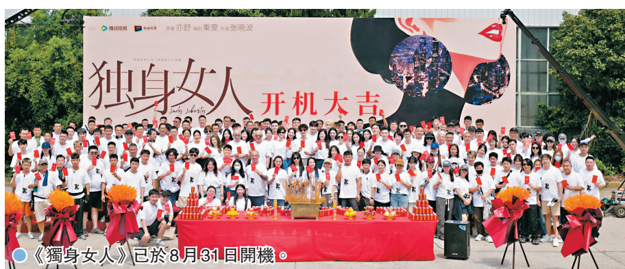
●《獨身女人》已於8月31日開機。

IP改編作為影視專案開發的重要陣地，在嚴肅文學IP影視改編上也留下了諸如《父母愛情》《白鹿原》等經典作品，根據亦舒作品改編的現實都市劇集《我的前半生》《流金歲月》《玫瑰的故事》也獲得市場和觀眾的認可。