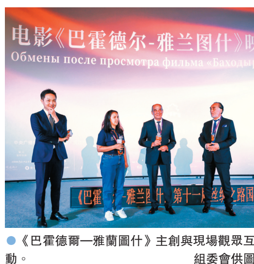
●《巴霍德爾—雅蘭圖什》主創與現場觀眾互動。

烏茲別克斯坦影片，涵蓋現代劇情片、歷史史詩、家庭片和傳記片等類型，全面反映了烏茲別克斯坦電影的廣泛主題和多樣化風格。每部影片都展現了烏茲別克斯坦的文化遺產和當代現實，為國際觀眾提供了一個獨特的機會，既可以了解烏茲別克斯坦電影人的最新成就，又能欣賞到豐富多彩的類型片和藝術表現手法。