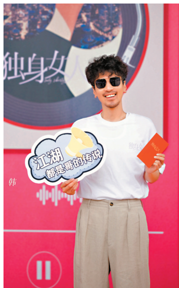
●趙又廷泡麵頭蓄鬚造型十分接地气。