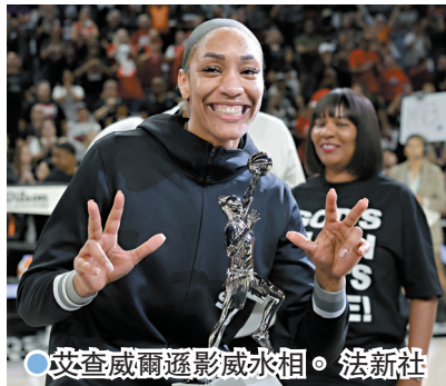
艾查威爾遜影威水相。

香港文匯報訊 綜合台媒引述外電報道，拉斯維加斯王牌隊中鋒艾查威爾遜，昨天獲選美國女子職籃(WNBA)年度最有價值球員(MVP)，獲得全部67張的第1名選票，總分670分成為聯盟史上第二位全票當選的球員，繼2020年及2022年後再膺WNBA的MVP。28歲的艾查威爾遜本賽季均26.9分、阻攻2.6次，都是聯盟之冠；本季她還創下單季得分破千紀錄，是聯盟史上第一人。