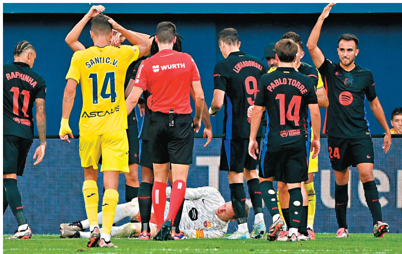
達史特根躺在地上，狀甚痛苦。法新社