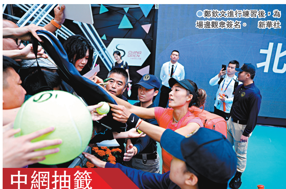
鄭欽文進行練習後，為場邊觀眾簽名。新華社