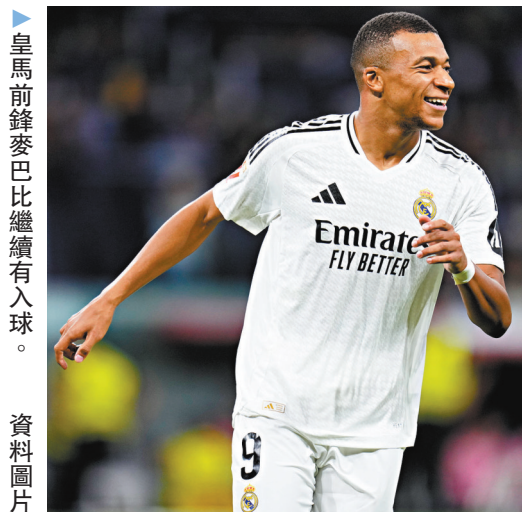
皇馬前鋒麥巴比繼續有入球。資料圖片

為了要好好把握巴塞隨時有失分的機會，皇馬亦不可放慢搶分的腳步，明日凌晨他們將會主場對陣艾拉維斯。新加盟的麥巴比連續四場比賽取得入球，漸讓對他和雲尼斯奧斯祖利亞難以共存的質疑減少，協助球隊在日前聯賽大勝愛斯賓奴4:1，在積分榜上繼續落後巴塞4分。雖然艾軍開季有2勝1和3負，表現並非太差，但他們對上兩次作客都在班拿貝球場捧蛋大敗而回，面對回勇的皇馬是役恐怕也是凶多吉少。