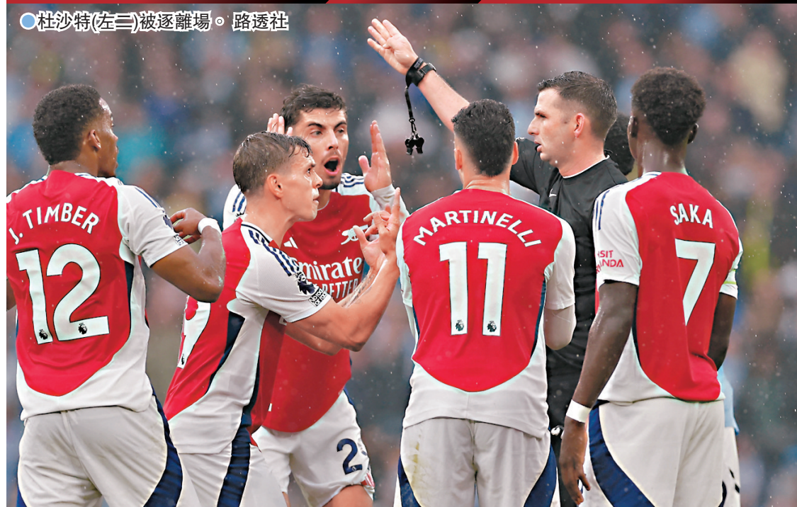
杜沙特(左三)被逐離場。