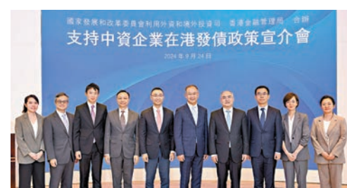
●國家發改委宣介團、國務院港澳辦代表與香港金管局等代表合照。

香港文匯報訊（記者 蔡競文）國家發展和改革委員會利用外資和境外投資司（下稱「外資司」）與香港金融管理局昨日在香港聯合舉辦「支持中資企業在港發債政策宣介會」。國家發改委外資司司長鄭持平與會並致辭，國家發改委宣介團進行有關支持中資企業境外發債的政策宣講。