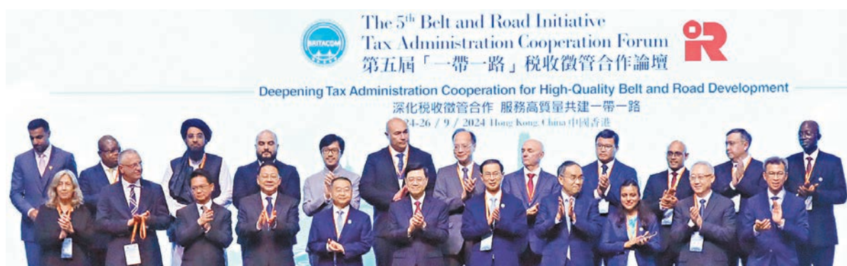
●與會代表及嘉賓在第五屆「一帶一路」稅收徵管合作論壇上合影。

香港文匯報訊（記者 周曉菁）第五屆「一帶一路」稅收徵管合作論壇一連三日在香港亞洲國際博覽館舉行，昨日論壇開幕有來自50個國家和地區的稅務部門負責人，經濟合作與發展組織、國際貨幣基金組織等13個國際組織，40餘家中外跨國企業代表共逾500人出席。論壇聚焦「深化稅收徵管合作服務高質量共建『一帶一路』」主題，共商「一帶一路」稅收未來合作。香港特區政府行政長官李家超在會上宣布，香港特區與土耳其簽訂全面性避免