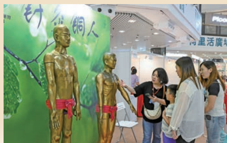
針灸銅人是我國針灸醫學最早的教學模型。