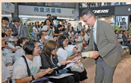
衛生署助理署長方浩澄致送中醫藥文化叢書予現場市民。