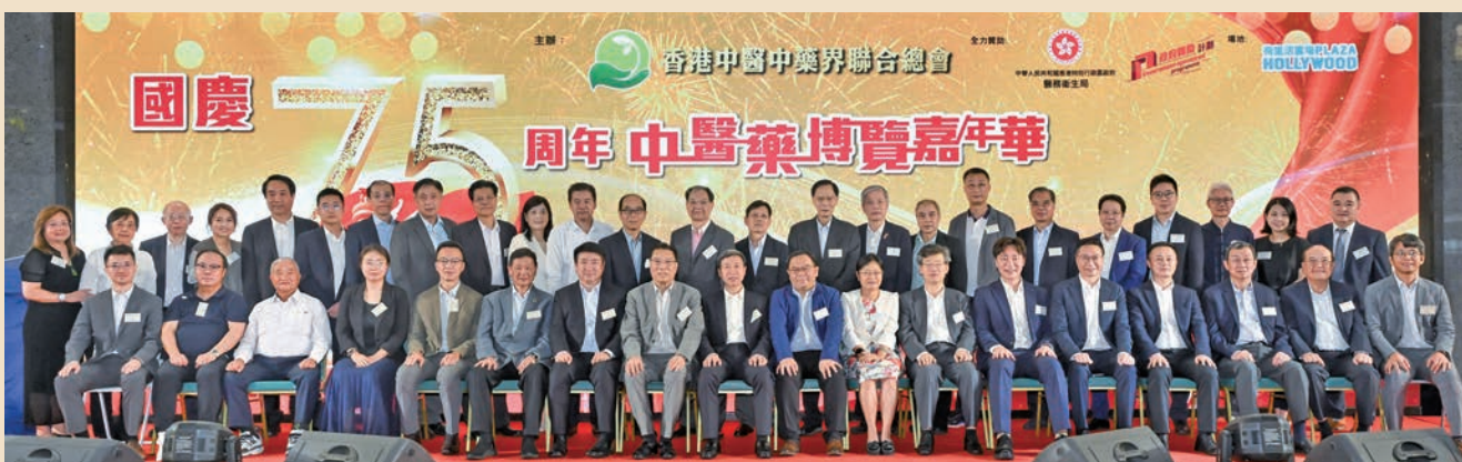
嘉年華活動現場主禮嘉賓合影。

為慶祝中華人民共和國成立75周年，香港中醫藥界聯合總會於9月21-22日，一連兩天假鑽石山荷里活廣場特別舉辦「國慶75周年中醫藥博覽嘉年華」活動，展示我國五千年傳統文化國粹，推廣中醫藥的普遍應用，深入社區，惠及市民。本次活動邀得國家中醫藥管理局副局長王志勇、港區全國人大代表胡曉明、中央政府駐港聯絡辦協調部副部長李玲、醫務衛生局中醫藥發展專員鍾志豪、立法會議員邵家輝等親臨主禮，意義重大，突顯了國家對於中醫藥的重視。