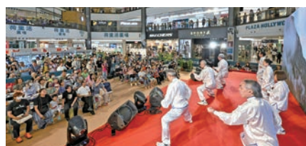
現場人流不斷，市民對於中醫藥資訊很感興趣，尤其是八段錦健身操。

中醫藥博覽嘉年華活動展覽區展出了常用中藥、名貴珍稀藥材、中成藥劑型、中草藥盆栽以及漁護署借展的瀕危動物標本等，加深市民對於中藥材的認識；活動現場還設有保健湯水遊戲攤位，由義工教導市民用傳統藥材秤去秤藥材，自制湯包，學習傳統智慧；現場還展示了原人大小的針灸銅人，市民可以學習穴位位置，為令市民體驗傳統文化；大會還設立了百子櫃打卡位，市民可以即場古裝扮演；大會並安排了中醫藥義診贈藥，由註冊中醫師提供免費診症，65歲以上長者優先，首75位75歲以上參加的長者，更可獲贈福袋。嘉年華活動人流不斷，深受市民歡迎，市民冀望大會日後繼續舉辦同類活動，以推廣中醫藥養生文化。