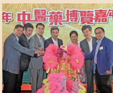
眾嘉賓為醒獅點睛。（左起：胡曉明、陸建偉、李應生、王志勇、李玲、吳振斗、陳永光）

為慶祝中華人民共和國成立75周年，香港中醫藥界聯合總會於9月21-22日，一連兩天假鑽石山荷里活廣場特別舉辦「國慶75周年中醫藥博覽嘉年華」活動，展示我國五千年傳統文化國粹，推廣中醫藥的普遍應用，深入社區，惠及市民。本次活動邀得國家中醫藥管理局副局長王志勇、港區全國人大代表胡曉明、中央政府駐港聯絡辦協調部副部長李玲、醫務衛生局中醫藥發展專員鍾志豪、立法會議員邵家輝等親臨主禮，意義重大，突顯了國家對於中醫藥的重視。