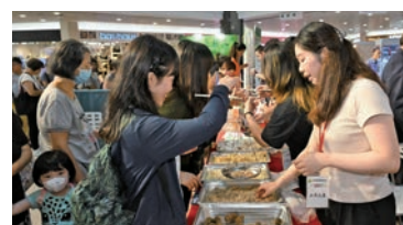
市民學習使用傳統藥材秤，自制湯包。