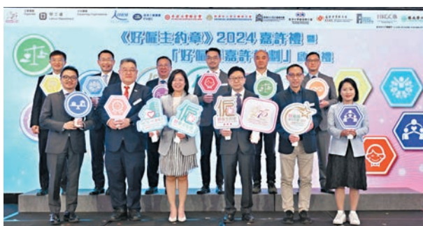
孫玉菡（前排右三）與陳穎超（前排左三）連同支持機構代表及評審團成員主持嘉許禮暨啟動禮。

三間《約章》2024簽署機構的代表在活動上分享實踐良好人事管理及家庭友善僱傭措施的成功經驗。