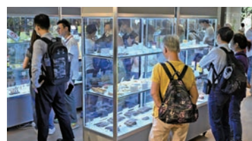
展櫃展出珍貴中藥材、瀕危中藥、常用中藥等。