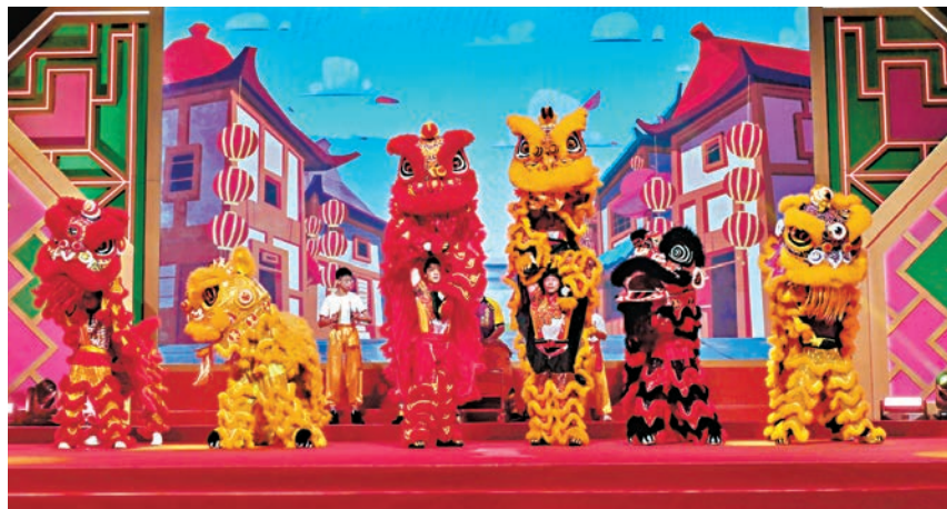
學生在啟動禮表演舞獅。

香港文匯報訊 特區政府教育局昨日舉行「心繫家國」——慶祝中華人民共和國成立75周年暨聯校國民教育活動啟動禮，同時宣布在2024/25學年聯同東華三院、保良局、中華基督教會香港區會、九龍樂善堂、香港津貼中學議會、香港直接資助學校議會、香港資助小學校長會和津貼小學議會，一起籌辦「心繫家國3.0」聯校國民教育活動系列，深化學生對中華文化的認識，厚植他們的家國情懷。