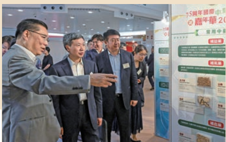
國家中醫藥管理局副局長王志勇（左二）參觀中藥材展版。

鍾志豪致辭表示，近年來香港中醫藥事業取得了顯著成就，首間中醫醫院和政府資助的中藥檢測中心永久大樓等項目即將投入服務。在傳承中醫藥傳統文化方面，他介紹了特區政府通過中醫藥發展基金支持的各種中醫藥宣傳和公眾教育活動，旨在將中醫藥知識普及到不同年齡層的人群中，包括中小學生及長者。他還提到，醫務衛生局中醫藥處將在今年12月舉辦首屆香港中醫藥文化節，並鼓勵中醫藥界和社會團體舉辦不同類型的中醫藥文化宣傳推廣和公眾教育活動。