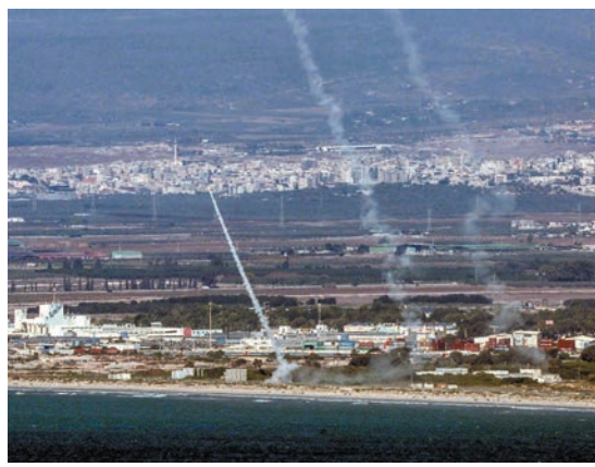
真主黨向以色列海法發射火箭彈。

庫華盛頓戰略與國際研究中心高級研究員拜曼形容，以軍若現時深入黎巴嫩，「就像在1980年(越戰結束後)對美軍說：『讓我們回到越南』一樣。」