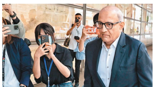
易華仁抵達法院受審。

當地媒體報道，新加坡上一次有官員涉貪被起訴受審，是1975年時任環境發展部部長黃循文，他被控受賄逾60萬美元。新加坡上一次有部長級官員涉貪則是在1986年，當時的國家發展部長鄭章遠因涉嫌受賄而遭調查，但他在審訊前自殺身亡。