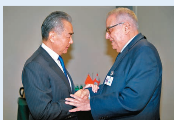
王毅(左)在紐約會見黎巴嫩外長哈比卜。