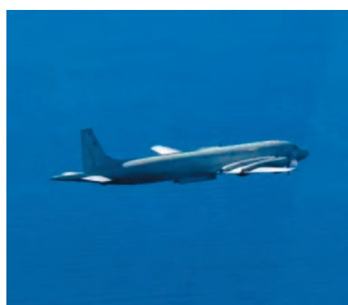
日方指俄羅斯伊爾-38型反潛機在北海道禮文島附近水域上空侵入領空。

日本內閣官房長官林芳正表示，日方對此事件極其遺憾，已通過外交渠道向俄方提出抗議，要求不再發生類似事件。日本官員還稱，這是自2019年6月以來，俄羅斯飛機首次公開入侵領空，當時一架圖-95轟炸機進入了沖繩南部的日本領空。俄羅斯方面尚未就此事作出回應。