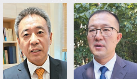
●國家航天局副局長卞志剛