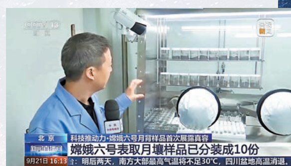
●嫦娥六號月壤樣品已裝成10份。網上圖片