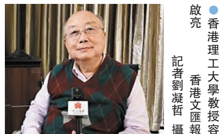
●香港理工大學教授容啟亮

香港理工大學不久前申請到嫦娥五號月壤樣品。容啟亮表示，月壤儲存在理工大學定製的存儲設備中，在存儲區可以直接傳到分析儀器上，通過譜儀進行