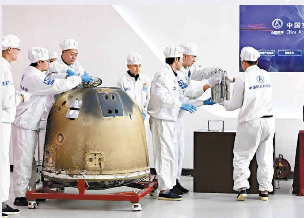
●2024年6月26日，在中國航天科技集團五院舉行的嫦娥六號返回器開蓋儀式現場，科研人員取出月壤樣品容器準備稱重。