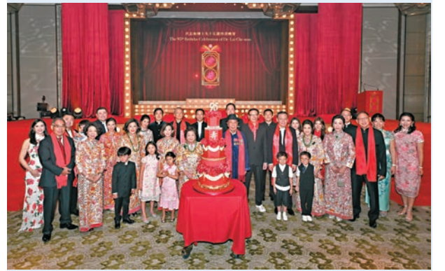
●呂志和與家人舉辦慶祝晚宴。

香港文匯報訊 嘉華集團主席呂志和的五位子女包括長子呂耀東、呂耀南、呂耀華、呂慧瑜及呂慧玲，近日於香港舉辦了一場獨特而盛大的慶祝晚宴，慶祝父親呂志和95歲「珍壽」。政界、商界、教育界及社會各界名流雲集，與呂志和的親朋好友、合作夥伴及集團資深員工等共慶壽辰。