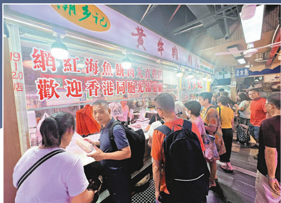
●鄰近蓮塘口岸的食肆、攤檔成為港人買餸的熱點，到處人山人海。

政府指定刊登有關法律廣告之刊物 獲特許可在全國各地發行 2024年9月 4 897001 360013 26 星期四 甲辰年八月廿四 初六寒露 間有陽光 一兩陣雨 氣溫27-32°C 濕度65-90% 港字第27204 今日出紙2疊8張半 港售10元