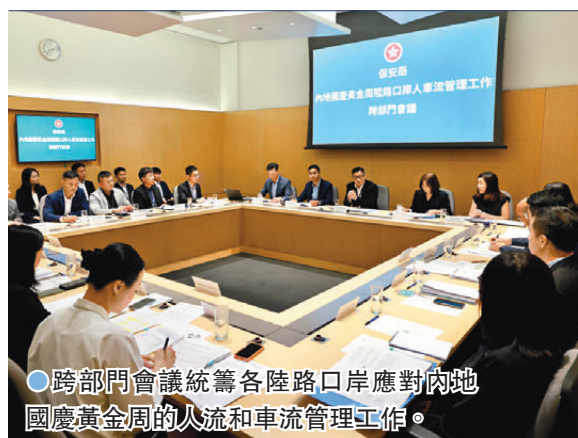
●跨部門會議統籌各陸路口岸應對內地國慶黄金周的人流和車流管理工作。

香港文匯報訊 香港特區政府保安局昨日召開跨部門會議，統籌各陸路口岸應對內地十一黃金周的入境和車流管理工作，以妥善部署接待長假期的旅客流量。會議由保安局局長鄧炳強主持，與會者包括文化體育及旅遊局、警務處、入境處、海關以及運輸署的代表。