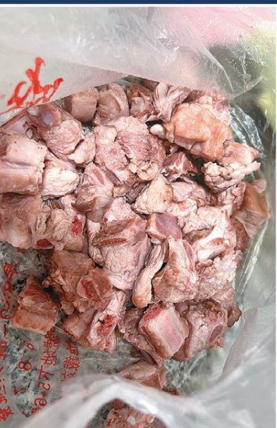
●半生熟的排骨抵港後仍在滲水。

本報直擊 港人北上買餸蔚然成風，香港海關昨日提醒攜帶未經煮熟肉類入境即屬違法。海關及食物安全中心昨日表示，今年首8個月檢獲1,324宗入境者非法攜帶受規管食物案件，比去年全年1,019宗大幅增加，較去年同期激增一倍；而走私物品中，62%是未經煮熟的肉類，比例較去年增加16個百分點。部分人因誤信將生肉真空包裝、錫紙包裝或汔水（滾水將表面燙熟）能免刑責而誤墮法網。香港文匯報記者日前在蓮塘口岸附近街市直擊，發現不少肉販為香港顧客提供免費汔水、真空處理、錫紙包裝等服務，並教唆說「包你過到關，試過咁耐都無事，唔使擔心」。有港人誤信肉販說話而帶未熟透的肉類抵港後，發現生肉已變味。