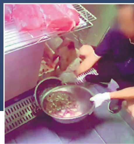
◀肉販在坑渠邊瀝乾剛才滾過熱水的生肉，然後入袋讓記者取走。