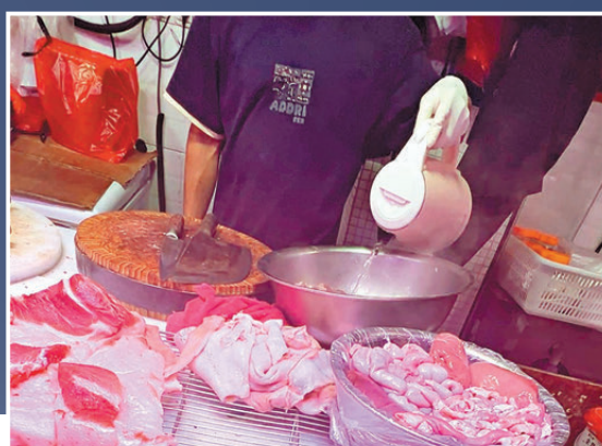
●肉販用滾水簡單「滾一滾」生肉，就表示過關無難度，宣稱「試過咁耐都無事，唔使擔心。」