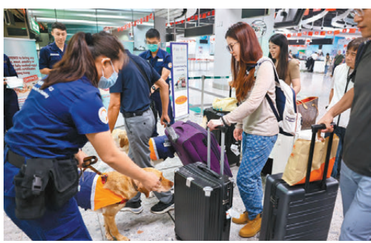
●國慶黄金周將至，海關及食安中心加強在口岸執法及宣傳工作。