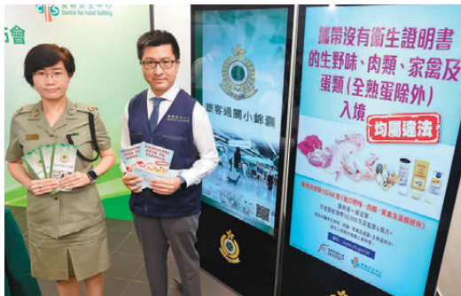
●海關及食安中心提醒，攜帶未經煮熟肉類、家禽及蛋類等受規管食物返港，可能要負上刑責。

香港文匯報訊（記者 蕭景源）香港海關和食安中心發現，經陸路口岸非法進口受規管食物的個案有上升趨勢，今年首8個月已錄得1,324宗，較去年同期上升一倍；亦超過去年全年的1,019宗，當中以香港居民攜帶未經煮熟肉類佔最多，大部分人因不熟悉法例，或被誤導以為將生肉真空包裝、錫紙包裝或汔水（滾水將表面燙熟），便不會觸犯法例。食安中心提醒市民，食物缺乏適當包裝儲存容易滋生微生物，對食物安全及公眾衛生構成負面影響。國慶黄金周將至，海關將在各口岸加強跨部門執法及宣傳。 今年首8個月查獲的非法進口受規管食物案件中，未經煮熟肉類最多，佔817宗（62%）；其次為蛋類，佔374宗（28%）；家禽則佔133宗（10%）。