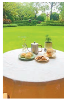
●「喜林苑」門前的下午茶。