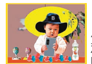
●手機比糖糖奶更甜美。