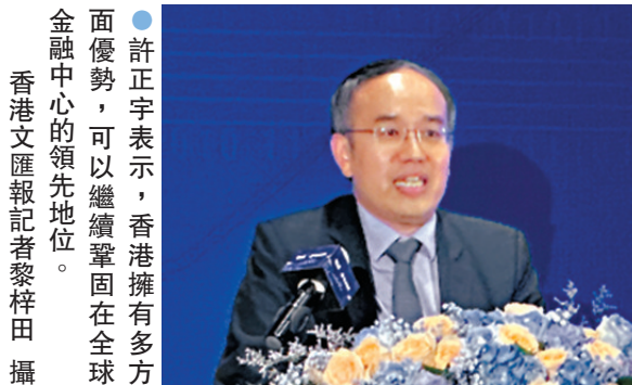
●許正宇表示，香港擁有多方面優勢，可以繼續鞏固在全球金融中心的領先地位。

金管局主管（市場發展）駱家珍昨亦表示，香港作為領先的國際金融中心和資產及財富管理樞紐，擁有成熟完善的金融市場、健全的司法制度以及具有競爭力的稅制，這些都為財富管理的發展提供了眾多優勢。香港最獨特之處在於它集中了中國的優勢和國際優勢，並與內地市場緊密聯繫，同時與國際高度接軌，為財富管理業提供了巨大的機遇。