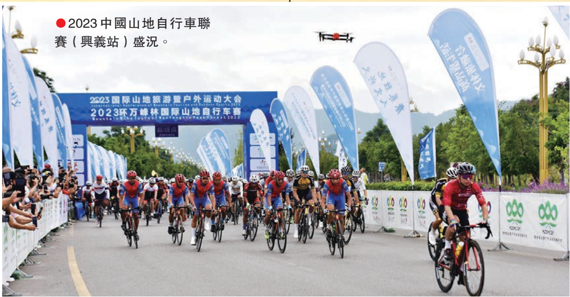
●2023中國山地自行車聯賽（興義站）盛況。

這位官員介紹，在本屆大會上，我們精心策劃了1場主體賽事活動和8場配套活動。目前已成功舉辦2024中國山地自行車聯賽（興義站）、2024中國·安龍國際攀巖周暨首屆「巖壁貴州」攀巖嘉年華等3項賽事活動，取得很好的效果和社會反響。接下來在大會期間，還將舉辦2024萬峰林萬人徒步大會、2024萬峰林徒步越野障礙賽、2024國際高橋極限運動邀請賽、2024第十八屆中國萬峰湖野釣大獎賽、2024中國「傳奇」挑戰賽（貴州·興義）等5項賽事及2024中國國際露營大會暨文體康旅裝備展。