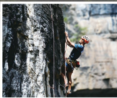
●安龍國家山地戶外運動示範公園自然巖壁紅點賽比賽中即景。

2024 國際山地旅遊暨戶外運動大會隆重舉辦，貴州省體育局官員客串「導遊」，解密貴州山地運動都有哪些新業態和新玩法？