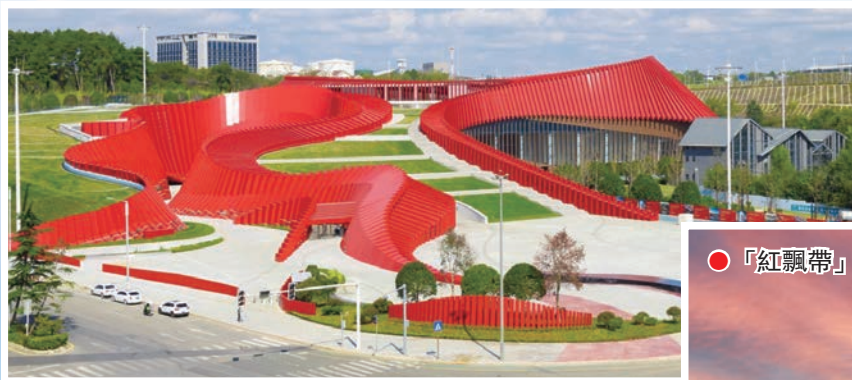
●位於貴陽龍洞堡國際機場附近的「紅飄帶」項目鳥瞰。該項目系中國首個以長征為主題的全域行浸式的數字體驗館，屬國家長征國家文化公園重點項目，集文化、科技、藝術於一體，投運即成貴陽旅遊網紅打卡點。

一是聚焦資源做足精深文章。圍繞「黃小西，吃晚飯」重點景區，推進世界級旅遊景區建設。推動「9+2+2」景區提檔升級，推出一批沉浸式、互動式、體驗式業態。堅持以文塑旅、以旅彰文，精心打造「村超」「村BA」等體旅融合產品，創新推出「紅飄帶」、《偉大轉折》紅色演藝劇目，加快發展「支支串飛」「小車小團」等運遊新模式，精心策劃紅色遊、研學遊、康養遊、鄉村遊等一批精品線路，推動景區景點「串珠成鏈」，為遊客提供