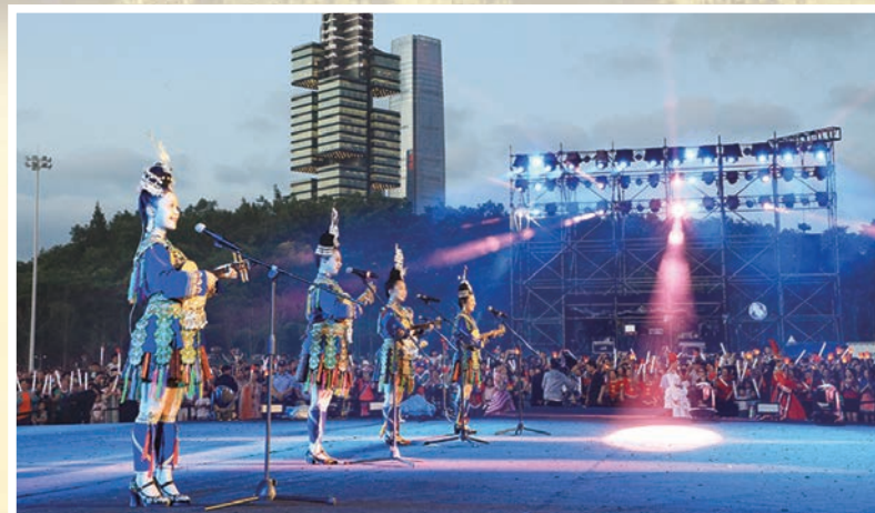
●自發的路邊音樂會，如今已被善加引導而成貴陽當前最靚的城市名片之一，貴陽因此被譽為萬眾狂歡的「愛樂之城」。

在這裏，科考與學術，今人與前賢，穿越時空的相遇，都是為對人類命運共同體、對地球共