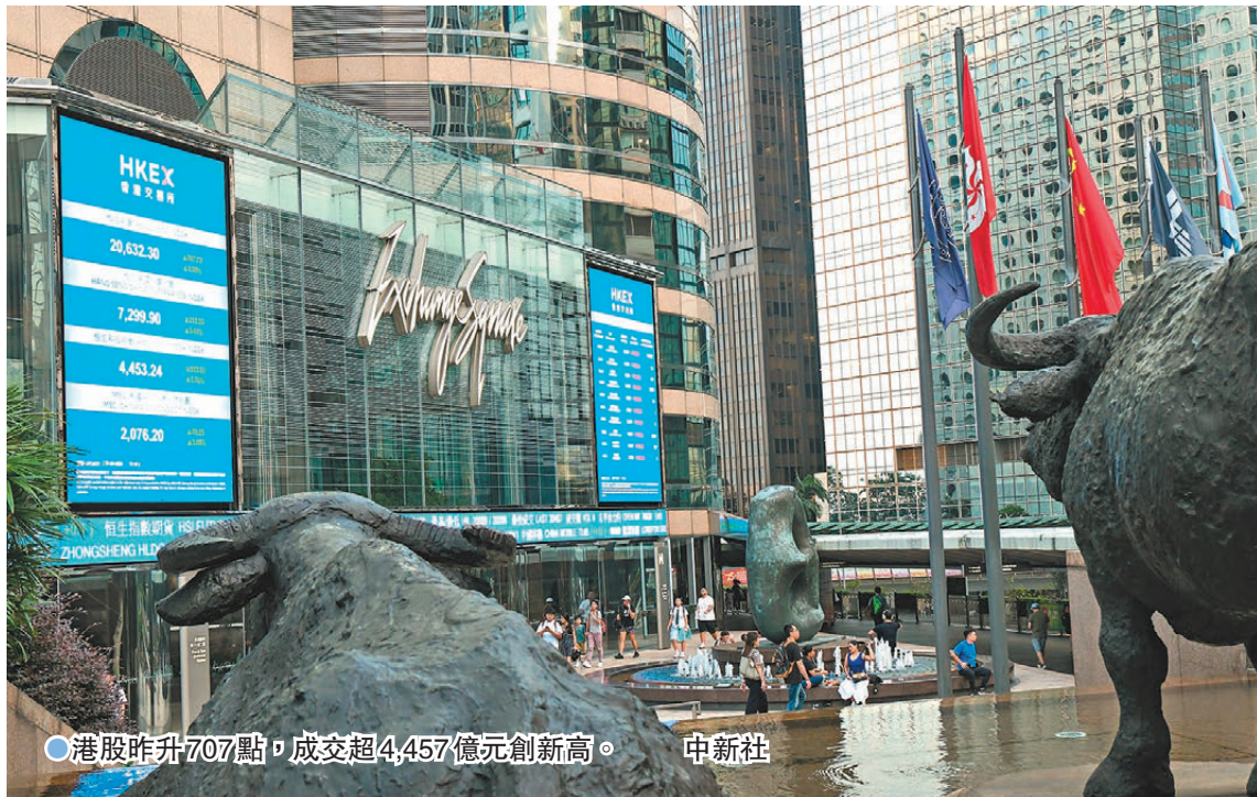
●港股昨升707點，成交超4,457億元創新高。