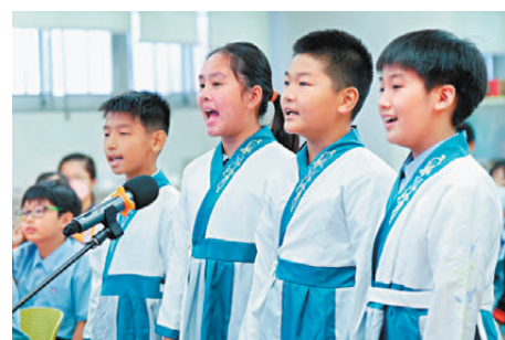
●圖為該校學生參與兩地交流活動。