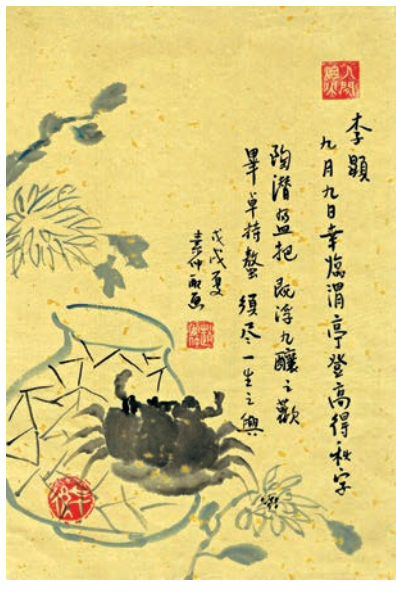
李顯 九月九日幸臨涇亭登高得秋字 陶潛盈把，既浮九龍之歡。畢卓持螯，須盡一生之興。

李顯，即唐中宗。讀歷史科時只知道他是唐朝第四和第六任皇帝，然而兩次在位也只共五年半。李顯是武則天的親生兒子，被母親所廢，待母親武則天死後二度登基。宮廷內鬥倒也沒有影響他遊玩作詩的興致。讀此詩，才知道他作為皇帝沒什麼大志，但詩詞倒也不錯。當時與他一起遊玩的詞學之臣倒能一起逍遙；春幸梨園，夏宴葡萄園，秋登慈恩寺浮圖，冬上驪山。九月九日登高當然持杯共飲，還有飲花酒，吃蟹。