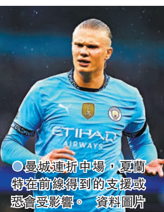
曼城連折中場，夏蘭特在前線得到的支援或恐會受影響。資料圖片

阿仙奴相信則可望在主場擊敗開季勢弱的李斯特城，重奪勝鼓。(Now621台今晚10:00p.m.直播)至於利物浦作客對積分榜墊底的狼隊，亦有力繼上周大炒般尼茅夫後再贏一仗。(Now611及621台周日凌晨0:30a.m.直播)。