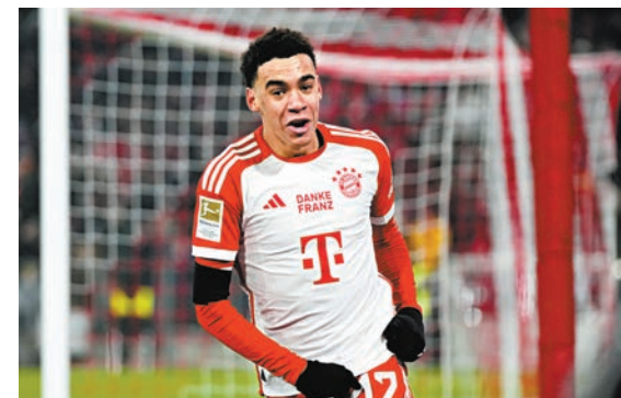
拜仁進攻中場穆西亞拿狀態大勇。