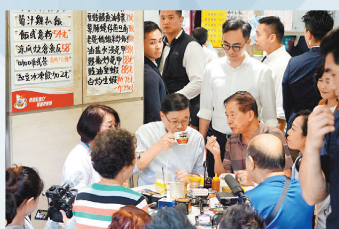
▲特首在茶記與劉先生「論政」。