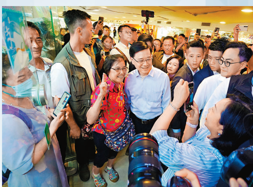
▲李家超到沙田區視察，與市民交流，聽取市民對新一份施政報告的建議。