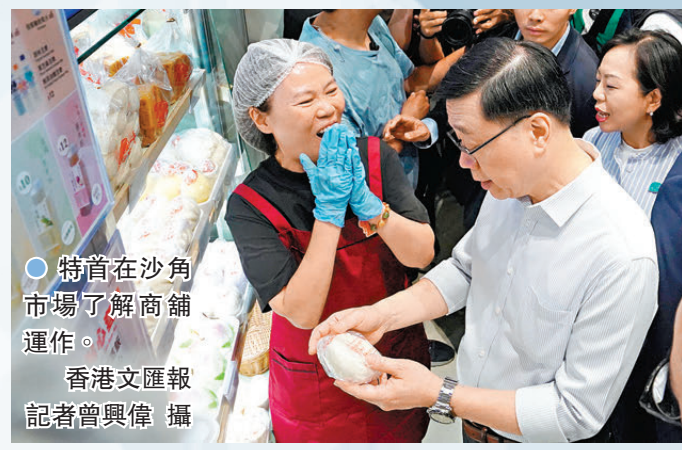
●特首在沙角市場了解商舖運作。