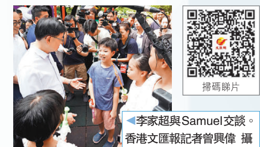
▲李家超與Samuel交談。