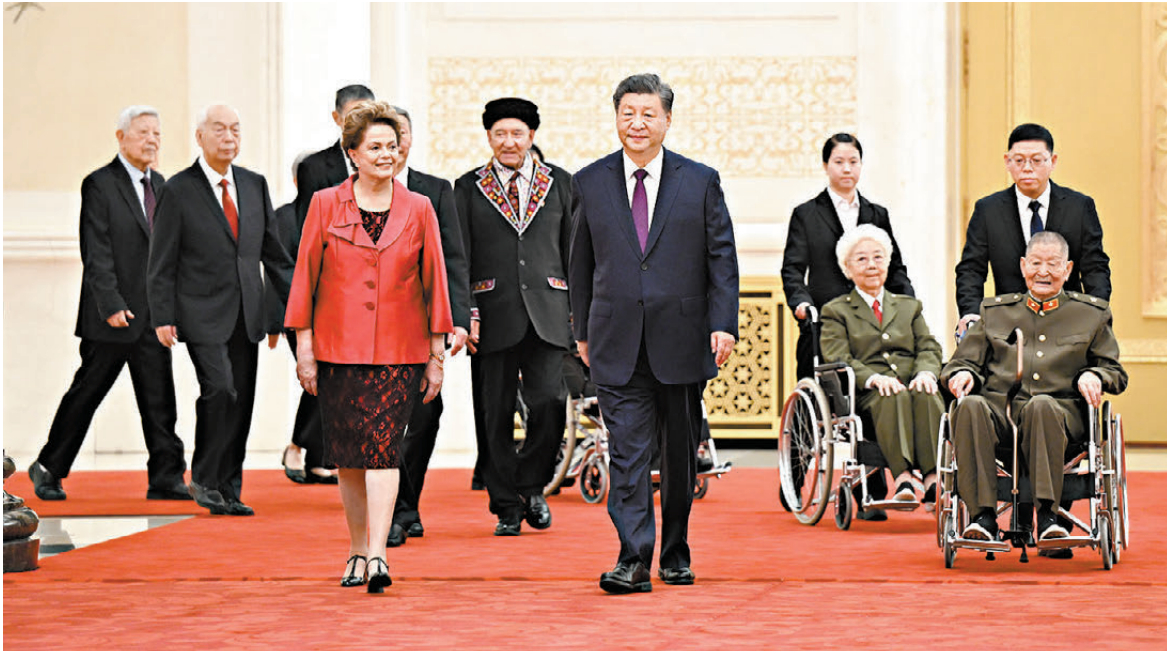
●習近平同國家勳章和國家榮譽稱號獲得者一同步入會場。