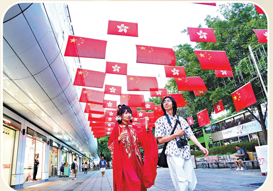
●尖沙咀街上旗幟飄揚，國慶氣氛極濃。