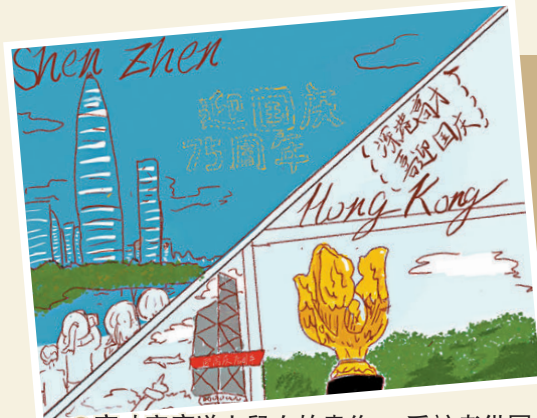
●高才家庭送上兒女的畫作。