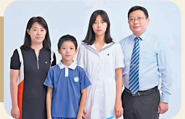
●高才家庭史興一家四口。