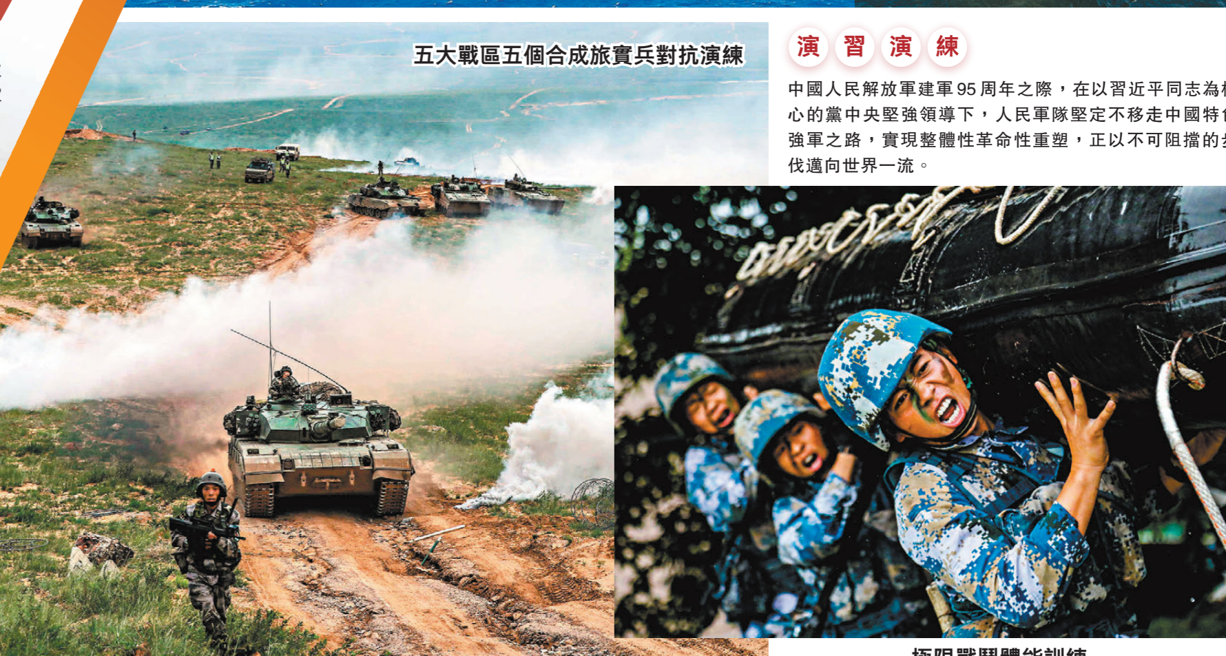
極限戰鬥體能訓練

中國人民解放軍建軍95周年之際，在以習近平同志為核心的黨中央堅強領導下，人民軍隊堅定不移走中國特色強軍之路，實現整體性革命性重塑，正以不可阻擋的步伐邁向世界一流。