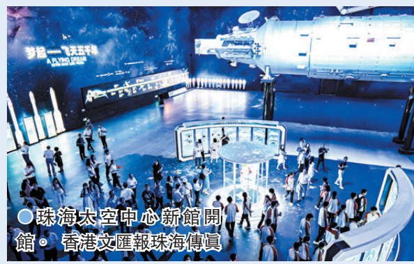
●珠海太空中心新館開館。