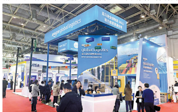
●過去一年美企在華營收企穩，80%的受訪企業實現盈利。圖為2023年首屆鏈博會上的亞馬遜展位。資料圖片

香港文匯報訊（記者 任芳頌 北京報導）美方近期出一系列涉華限制措施，包括提高部分中國商品的301關稅，加強對量子計算、半導體製造等技術的出口限制等，備受輿論關注。中國貿促會新聞