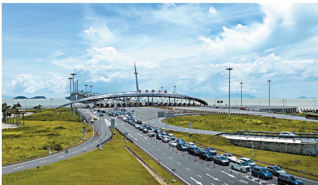
●港珠澳大橋珠海公路口岸「小客車通關效率提升項目」一期29日建成啟用，提升小客車出境通關能力近50%。

香港文匯報訊（記者 方俊明 珠海報導）「港車北上」更便捷！港珠澳大橋珠海公路口岸「小客車通關效率提升項目」一期29日建成啟用，提升小客車出境通關能力近50%。而二期建設同時啟動，將通過新增入境小客車「一站式」通道、改造入境大客車通道兼容驗放小客車等措施，全面推動提升大橋珠海口岸通關高峰期入境應急驗放能力。而「大橋口岸服務區」也於29日正式揭牌，設新能源充電車位238個，兼具珠海市級導遊服務中心、旅客服務中心功能，並銜接研學、親子遊、團建、紅色旅遊等項目。