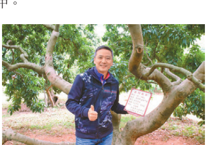
這棵古樹名木樹名是：掛綠荔枝，樹齡超過四百年。