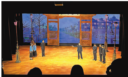
話劇《錢學森》的演出現場。