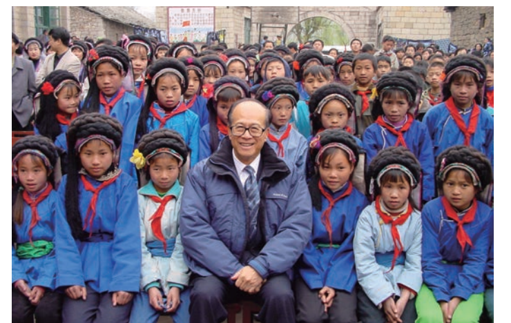
■李嘉誠於1980年創立李嘉誠基金會，視之為他的「第三個兒子」，投入其三分之一資產，至今李嘉誠已捐出總款逾300億港元，其中約80%項目在大中華地區。

李嘉誠說：「在華人傳統觀念中，傳宗接代是一種責任，我呼籲亞洲有能力的人士……能視幫助建立社會的責任有如延續後代同樣重要，選擇捐助資產如同分配給兒女一樣，那我們今天一念之悟，將會為明天帶來很多新的希望。」他更表示，一生最重要的決定是成立基金會，能盡心之所懷服務社會，感刻至深。自2018年退任長江集團主席後，李嘉誠旋即披上新戰衣，全心全力投入基金會工作。