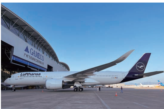
■廣州飛機維修工程的機庫。

和記港口在「一帶一路」沿線14個國家33個港口據點經營業務，2023年佔整體吞吐量達八成。和記港口亦不斷物色新的及現存的碼頭設施，以迎合「一帶一路」的需求、促進沿線國家的經貿發展。