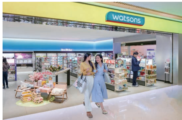
■保健及美容零售店「屈臣氏」。

配合國家改革開放及經濟增長之路，長江集團（旗艦企業包括長江實業、長江和記、長江基建及電能實業）早於上世紀八十年代初已於內地開展業務，長江和記旗下之屈臣氏集團首度進軍內地零售市場；而屈臣氏實業之內地飲料廠亦擁有悠久歷史。電能實業自上世紀八十年代中為內地電廠提供顧問服務、培訓、技術審核及項目管理。和黃中國於上世紀八十年代末進軍飛機維修工程業務，而至九十年代初，和記港口及長江基建亦相繼踏足內地的港口、基建及電力業務；赫斯基中國並開展南海的天然氣勘探和開發。至於地產項目方面，集團於1994年在廣州推出首個住宅項目「怡苑」，其後眾多住宅、商業及酒店項目相繼於其他多個內地城市推出。集團自千禧年起涉足醫藥業務，進一步拓展內地業務規模。