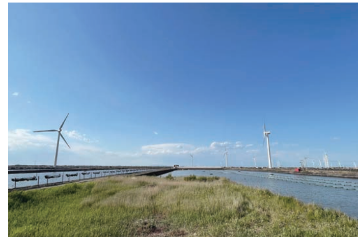
■電能實業旗下位於河北省的樂亭風電場營運33台1.5兆瓦雙饋型感應風力發電機。

電能實業旗下的港燈，透過與國家電網旗下南瑞集團有限公司合作，優化港燈電網的營運，並將國內創新技術結合香港的實際情況，促進香港能源轉型。港燈亦繼續配合「一帶一路」建設，連續七年支持由香港理工大學及西安交通大學成立的