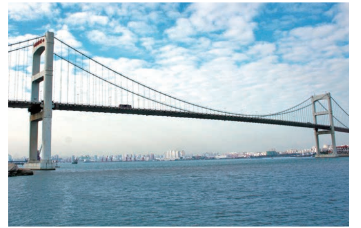
■長江基建於1993年首度參與發展內地收費道路及橋樑項目。

集團亦在香港及內地經營基建材料製造業務，並一直參與各項基建工程，包括大型地標如港珠澳大橋及廣深高速鐵路等。