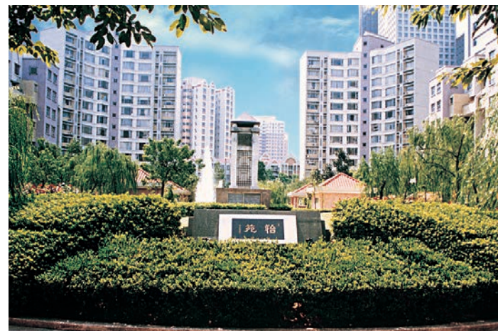
■長江實業於1994年在廣州推出首個住宅項目「怡苑」，其後多個項目於內地不同城市相繼落成。

現時，和黃醫藥已發展成為一家處於商業化階段的创新型生物醫藥公司，擁有集新藥發現、開發、註冊、生產及商業化為一體的全產業鏈平台。和黃醫藥致力於將自主研發的創新療法帶向全球患者，公司的首三個創新抗腫瘤藥物—味嗒替尼膠囊、索凡替尼膠囊和賽沃替尼片已在中國獲批上市。其中，味嗒替尼亦於美國、歐洲和日本獲批上市，成為中國創新藥出海的代表之一。