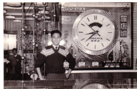
▲楊受成在父親的錶行幫手，培養了日後獨到的商業眼光。

不忘初心，方得一路向前。英皇集團起源於1942年楊受成父親楊成在香港開設的一家小型鐘錶店「成安記錶行」，及後鐘錶零售業務成為集團的基石業務，憑藉楊受成高瞻遠矚及勇於開創的過人魄力，順應時勢開拓多元化業務，從而擴展至今日的綜合企業集團，經營範圍涵蓋地產、金融、鐘錶珠寶、娛樂文化、酒店、數碼媒體及傢俬等，旗下共有7間公司於香港交易所主板上市。