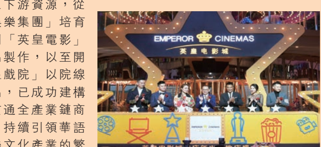
▲英皇集團於內地積極開拓電影院線，致力打造高端電影院品牌「英皇電影城」。

除電影製作外，英皇集團於內地積極開拓電影院線，致力打造高端電影院品牌「英皇電影城」，自2015年起不斷擴張，最新影城將於今年10月在北京市地標性區域三里屯太古里開業，進一步鞏固市場地位。香港的電影院「英皇戲院」則自2017年起，陸續進駐中環地標娛樂行、尖沙咀國際廣場、銅鑼灣時代廣場等核心商區。至今，英皇影院集團已於11個城市開設共25間影院，影廳數達187個，可提供超過27,000個座位。