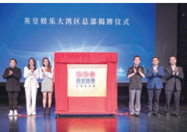
▲2021年4月22日，英皇娛樂大灣區總部正式落戶廣州，攜手大灣區共同推進文化娛樂產業蓬勃發展。

2021年，英皇娛樂大灣區總部正式落戶廣州，響應《粵港澳大灣區發展規劃綱要》要求，致力推進粵港澳大灣區之間的文化交流與合作，培育更多演藝新秀，為大灣區的文化繁榮注入新活力。2024年，英皇娛樂與中央戲劇學院繼續教育中心宣布達成戰略合作，共同打造「中戲英皇演藝學堂」，創立了演藝人才實踐教學的新生態，教學與資源直接對接，推動產教融合，為演藝青年提供專業台階。