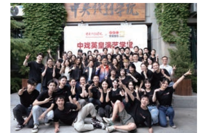
▲今年，中央戲劇學院繼續教育中心與英皇娛樂達成戰略合作，開設「中戲英皇演藝學堂」，培養新生演藝力量。