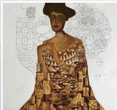
曹澤心的作品《阿德勒·布羅赫-鮑爾夫人》體現了二戰期間女性的智慧和內涵。